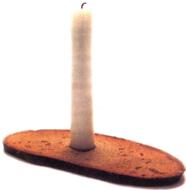
“晚餐面包”当作烛台，由汉堡 Thesenfitz & Wedekind 双人设计室设计。

作家上面那段话，会让吃简便晚餐中精通音乐的人马上在脑海中想起一首家喻户晓的歌，然后他就会情不自禁地唱起来：“噢，傍晚我多么惬意，/ 傍晚我，/ 寂静中晚钟响起，/ 晚钟响起，/ 叮当，叮当，叮当！”