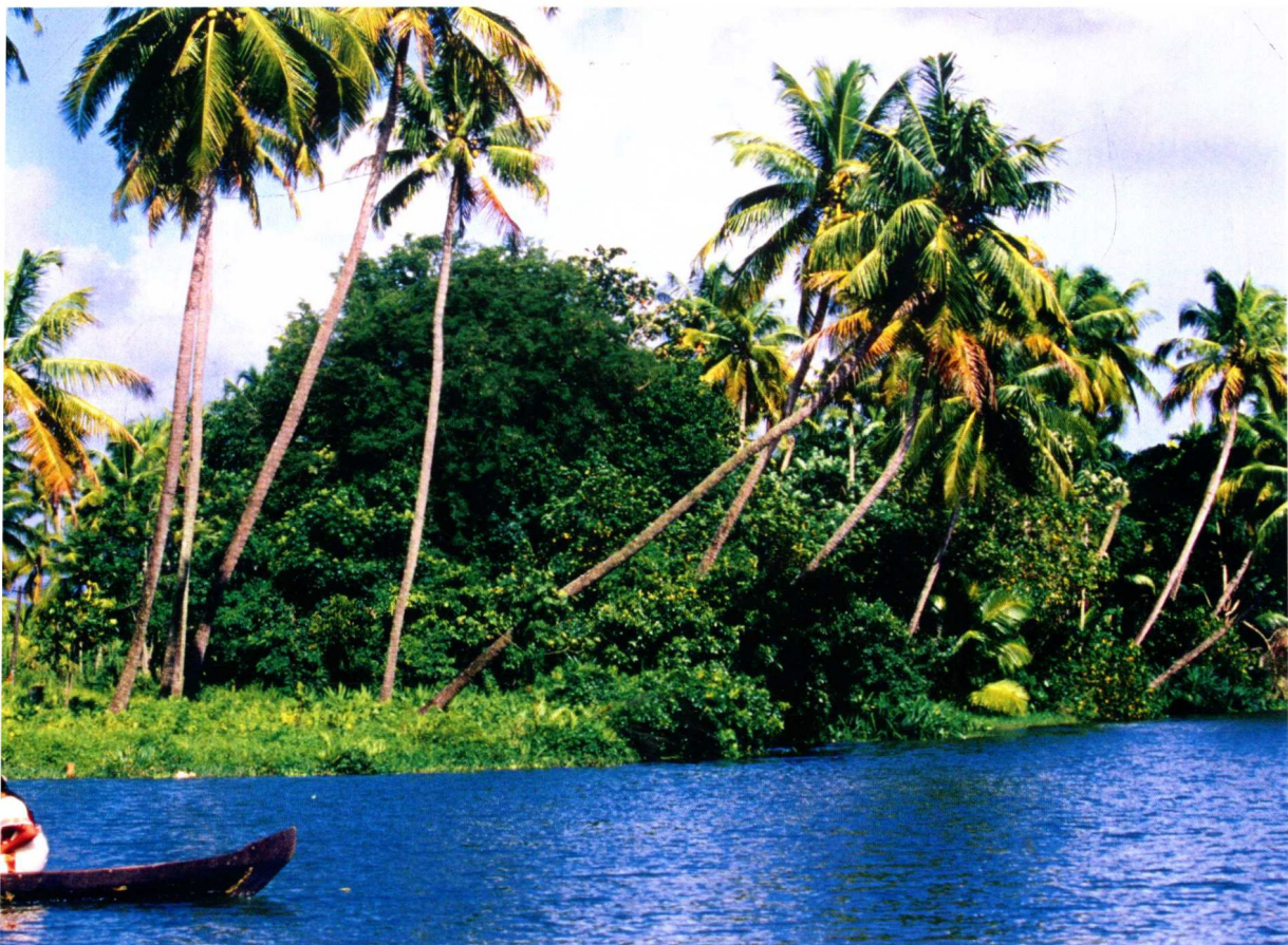
在印度喀拉拉邦乘坐皮划艇或者轮船，在神秘的水域里，探索世界上少有人知的最佳海滩。