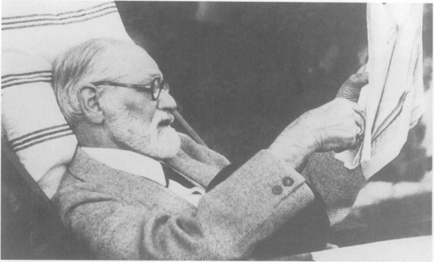
1932年，弗洛伊德在赫希罗特。这是他女儿安娜和他的美国朋友多罗西·伯林海姆拥有的一所离维也纳不远的农舍。