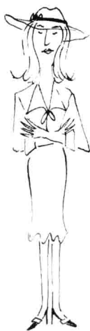
巧克力高跟鞋老师