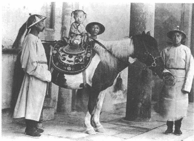
年幼的光绪帝故宫骑马照