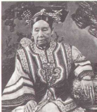
光绪皇帝爱新觉罗·载湉