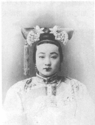
光绪帝之爱妃——珍妃

区区小寇就会一鼓荡平，故在战端初开之际，她对光绪的主战并不介意。随着战事的发展，慈禧便认为当初的主战是一种错误的决定。因为甲午年是慈禧的六旬庆典，她准备大张旗鼓地举行庆祝，而这场旷日持久的战事势必会影响到她的庆典活动。