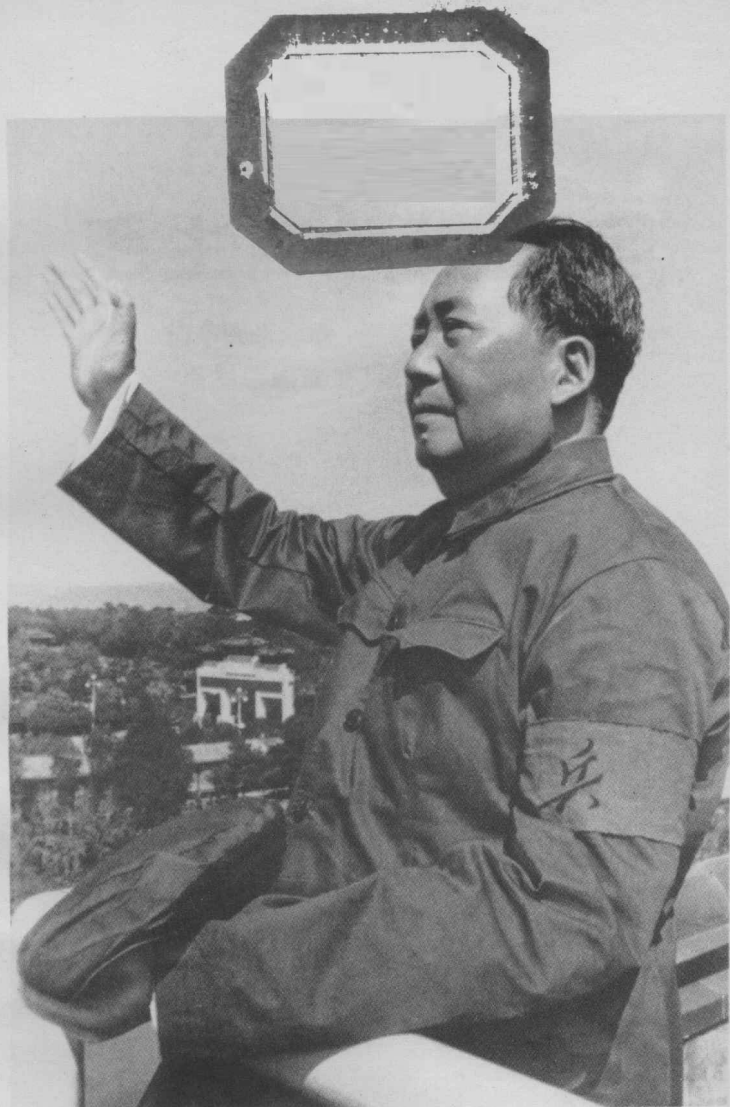
伟大领袖毛主席一九六六年八月十八日， 在天安门城楼上，向革命群众和红卫兵招手。