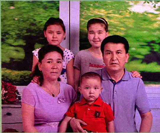
اۆتوردىڭ وتباسى (قۇانش باسبولات ۇلى ، جۇبايى - شىمانگۇل باقتىجان قىزى ، قىزدارى - پارىزا ، ۋەنارا ، ۇلى - اىبارس).