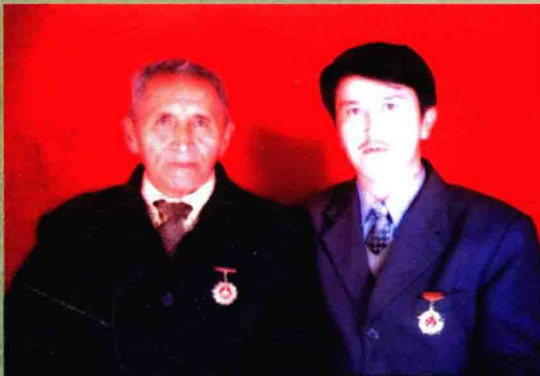
اۆتور ، اقىن ، پەداگوگ تولىپبەرگەن مەشپەتوۋبەن بىرگە