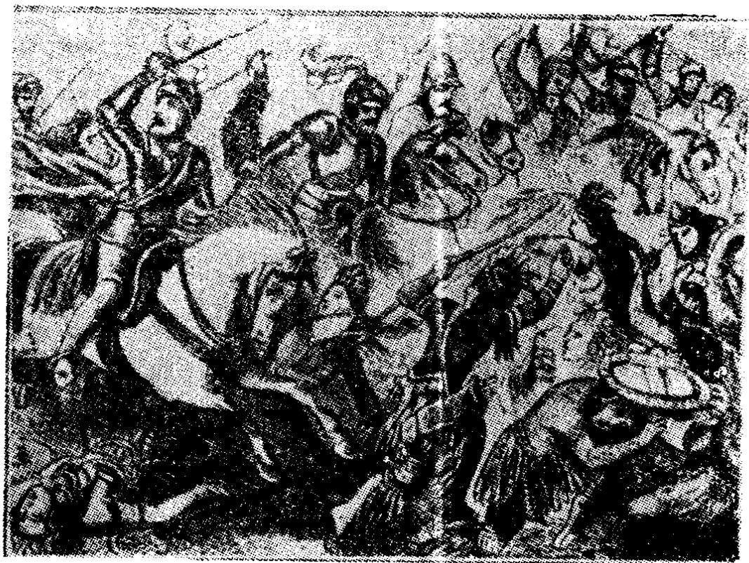
印第安人和西班牙征服者的斗争

保卫自己的家乡，进行过长期的浴血战斗。在乌拉圭，有一族印第安人一直反抗了三百年之久。在智利，另一族人则始终没有让侵略者践踏过他们神圣的领土。在巴西，从1630年开始，两万多黑人聚集在丛林里和葡萄牙殖民者前后血战了六十七年，这就是历史上著名的巴尔梅尔斯共和国。 ① 这些起义和反抗虽然大都失败了，然而在历史上却留下了不可磨灭的光辉。