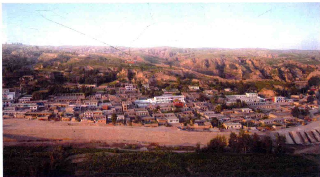
图12 木瓜园堡全景，2010年摄