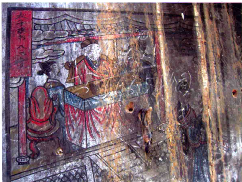
图14 定边大边长城壁画，2010年摄