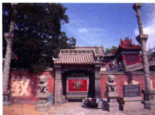
图4 榆林城戴兴寺（正德时期延绥镇总兵官戴钦建），2009年摄