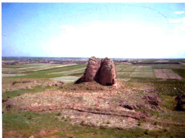
图15 定边南西道长城墩台， 2010年摄