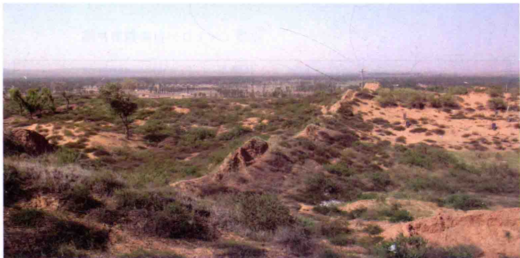
图3 榆林大边走马梁长城，2009年摄