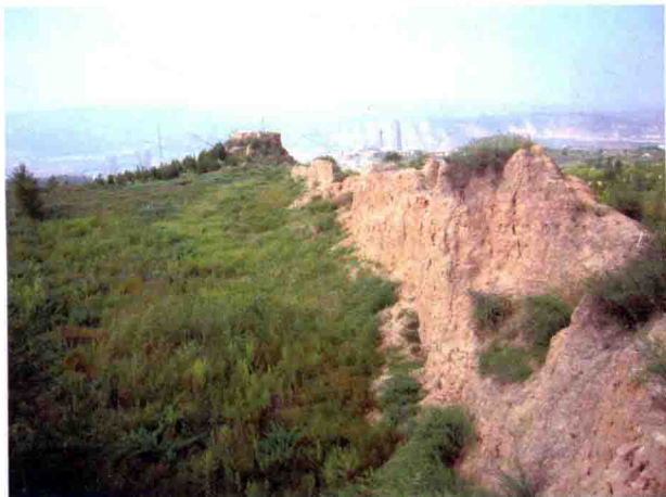
图10 神木堡九龙山东墙， 2010年摄