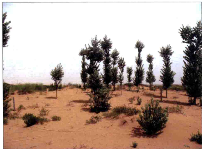
图22 毛乌素沙地，2009年摄