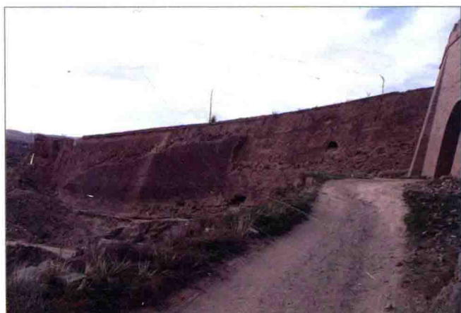
图9 波罗堡小西门，2009年摄