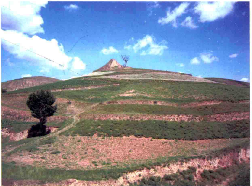
图18 新安边营北墩远景，2010年摄