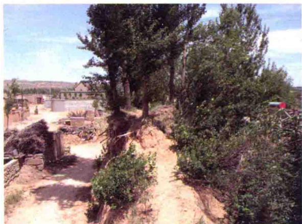
图7 鱼河堡残墙，2009年摄