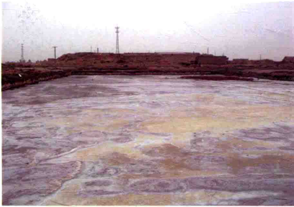
图16 盐场堡北盐场，2009年摄