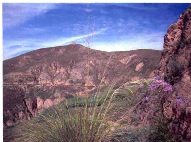
图20 石涝池堡北墩，2010年摄