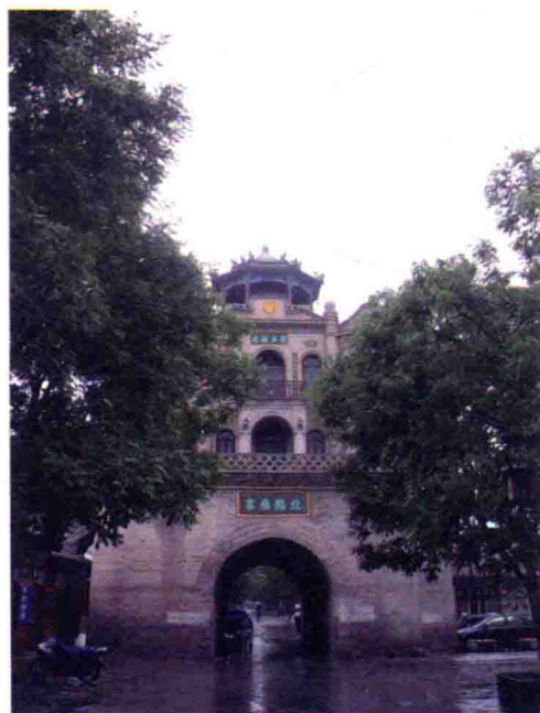
图5 榆林城钟楼（始建于明），2009年摄