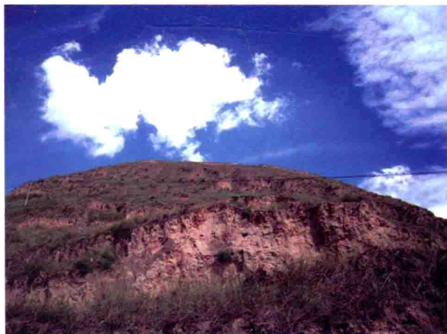
图19 石涝池堡南墙，2010年摄