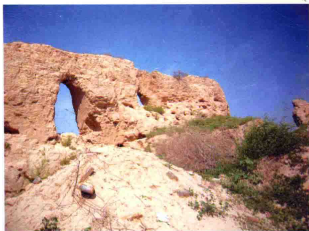
图11 砖井堡东墙，2010年摄