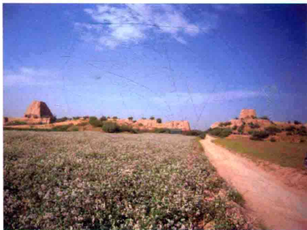
图13 旧安边营五里墩，2009年摄