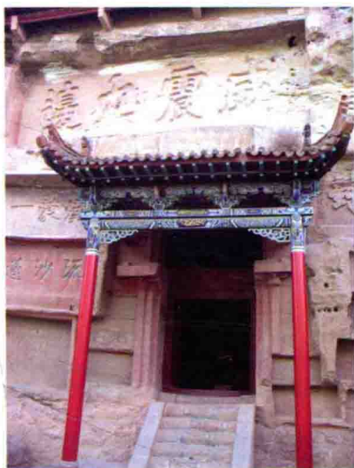
图6 榆林城红石峡摩崖石刻，2009年摄