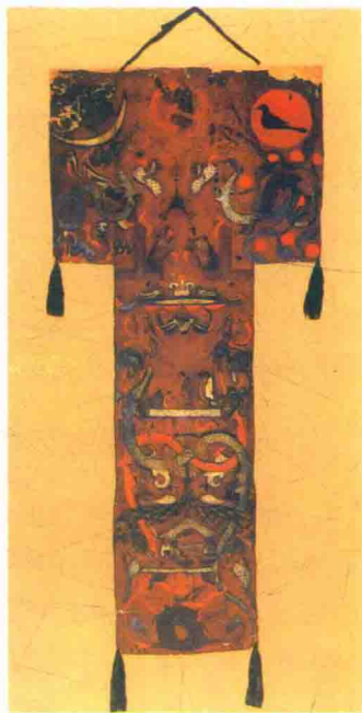
图 1-2 引魂升天图

表现实际不可能却梦想会实现的愿望也是原生艺术的一个基本特点，尤其在古代艺术作品中可以发现这一特征。图 1-2 《引魂升天图》是 1972—1974 年在长沙马王堆出土的西汉古墓中的一幅帛画，画作呈 T 字形，长 205 厘米，上端宽 92 厘米，下端宽 47.7 厘米，现藏湖南省博物馆。画的顶部裹有一根竹竿，并系以棕色丝带，可以张挂，古代称“非衣”或“招魂幡”，根据当时的葬制文化俗信，此幡的作用是招魂复魄，即帮助人死后游走的魂魄归来，使招回的魂升天，魄附体入地为安。画面由上至下可以分为天界、人间和地界三个部分。天界的右上角绘有 9 个太阳，其中大太阳中居住着一只鸟，应为“金乌”，其下的扶桑树间还有 8 个小太阳。天界左上角绘有一弯新月，月中有蟾蜍、玉兔，月下则有正在奔月飞翔的嫦娥；日月间端坐着一个披发、人首蛇身、能呼风唤雨、左右昼夜四季的神——“烛龙”，还有天门、门