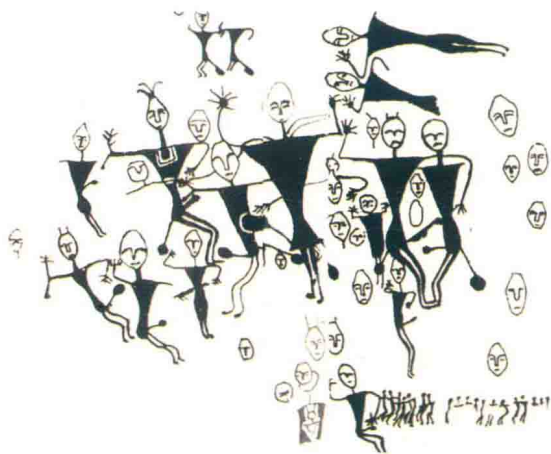
图 1-1 新疆古代岩石浮雕

中国新疆昌吉回族自治州呼图壁县的天山腹地两条山溪汇流处的西北岸新第三纪的粉砂岩壁上发现的天山塞种人遗留下来的一组反映生殖崇拜的岩石浮雕。据考证，此处岩石浮雕创作于距今 3 000 多年的原始社会后期父系氏族社会阶段。岩画距地表约 10 米，长 14 米，高 9 米，面积 126 平方米。画面上有二三百个大小不等、身姿各异的人物和动物形象，人物或站或卧，或衣或裸，男女合图、双头同体、三头同体，头戴高帽、帽著翎毛，作交媾或舞蹈状。大的画像高达 2 米，小的不到 20 厘米。画中的男性面型瘦长、浓眉大眼、阔嘴、高鼻、剽悍粗犷，女性体态苗条、三围突出、婀娜多姿。通过跨时空比较不难发现，毫不掩饰地直接表现对性活动的痴迷和生殖崇拜似乎是古代原生艺术和精神障碍患者创作的原生艺术作品的一个共性。