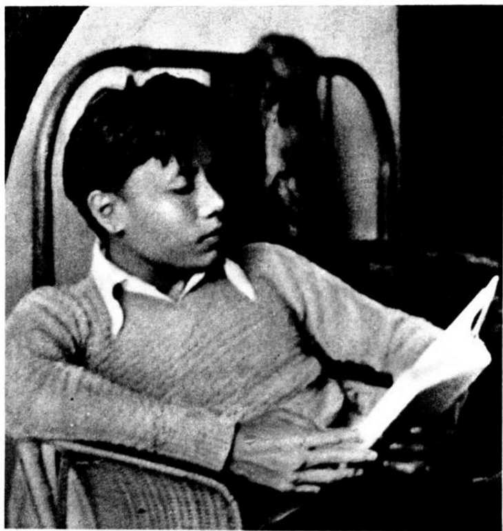
青年时期的艾思奇同志在读书