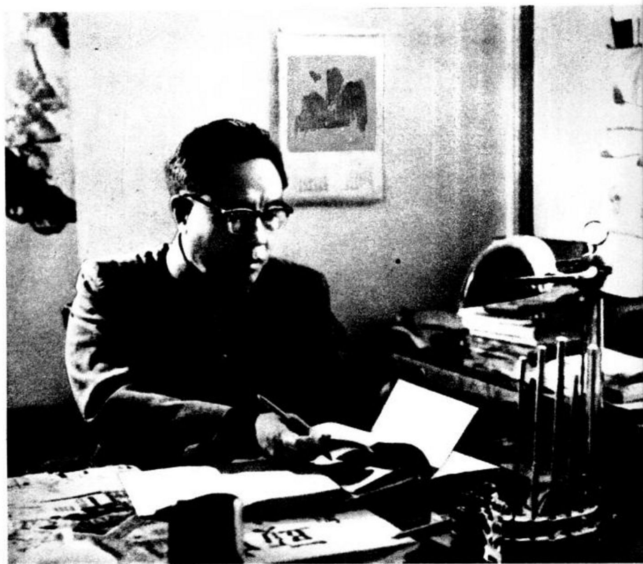
艾思奇同志在书房里