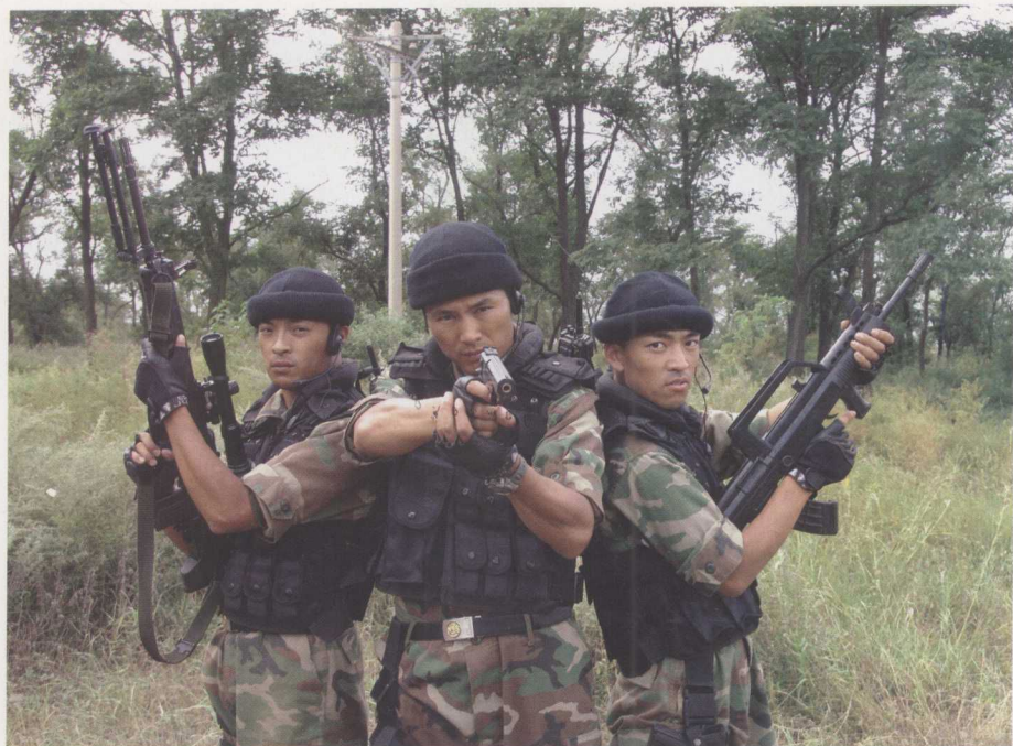
《陆军特战队》精彩剧照 1 ▲