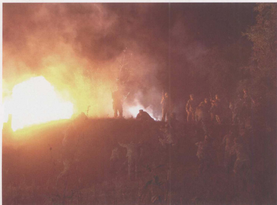
《陆军特战队》精彩剧照 6 ▼