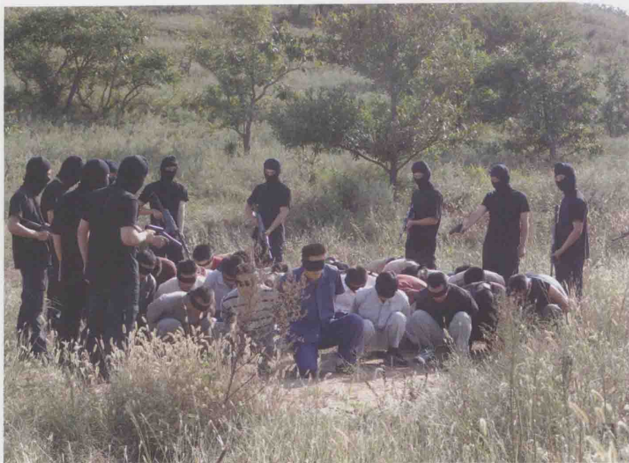
《陆军特战队》精彩剧照 7 ▲