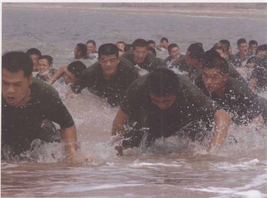
《陆军特战队》精彩剧照4 ▼