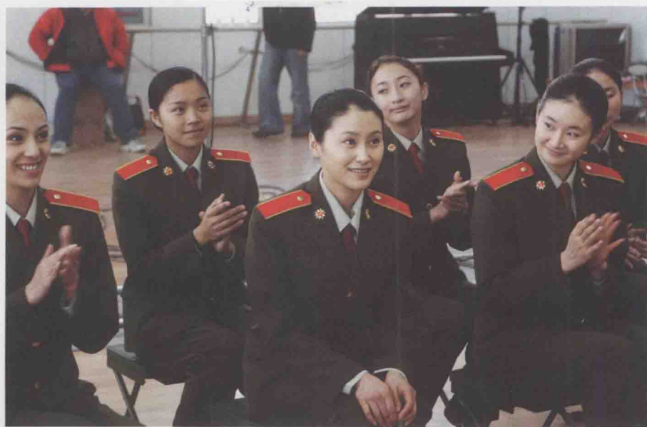
《陆军特战队》精彩剧照 8 ▼