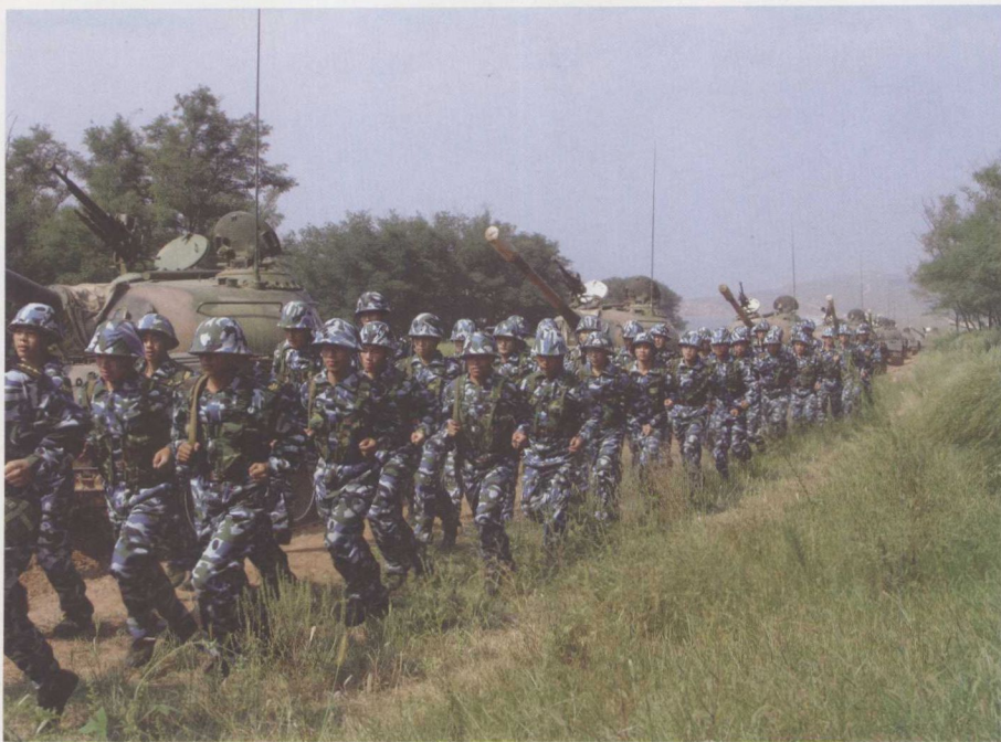
《陆军特战队》精彩剧照3 ▲