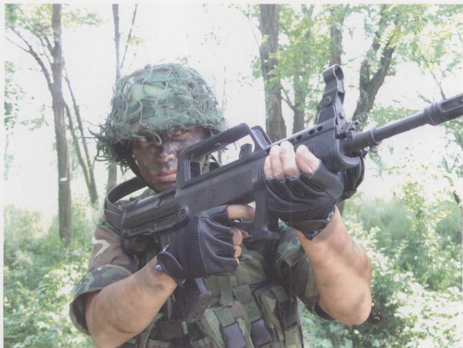
《陆军特战队》精彩剧照 2 ▼