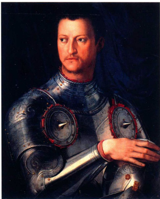
阿尼奥洛·布龙齐诺《科西莫一世肖像》(局部), 1545

乔尔焦·瓦萨里很高明，他沿着法官思路创造了一种建筑结构，既不局促也不夸张，而是一道均匀连接的墙，从一侧围住老宫和朗齐门廊之间的广场，从另一侧围住阿尔诺河上的街廊。此外，在1565年，为了弗朗切斯科一世与奥地利公主约翰娜的婚礼，天才的城市规划专家瓦萨里建了一个小走廊，作为一条横跨阿尔诺河的空中道路，将封闭在厚重石墙内的中世纪城区延伸到河那边的山岗上，连接起正在兴建的皮提宫，形成了一个新城市。瓦萨里本人曾这样强调过遇到的技术困难：“我从未让人干过这种土木活儿——是在河上打地基，难上加难，几乎房子就在空中！”