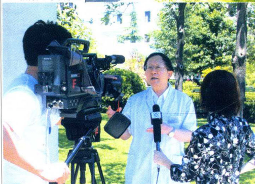
洪昭光教授在接受中央电视台和本社记者采访 ●