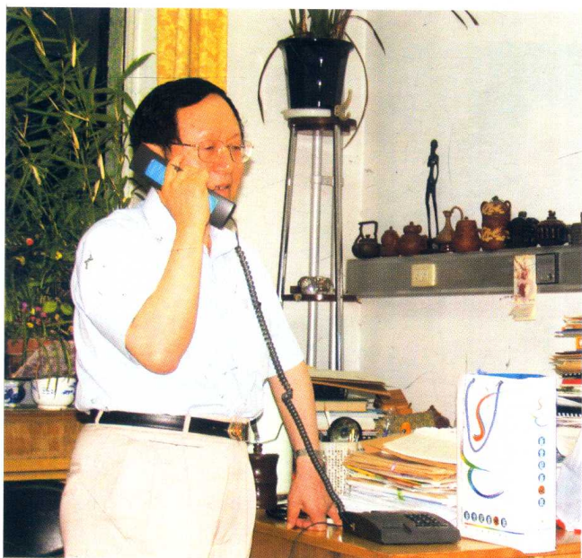
洪昭光教授在医院的办公室 ●