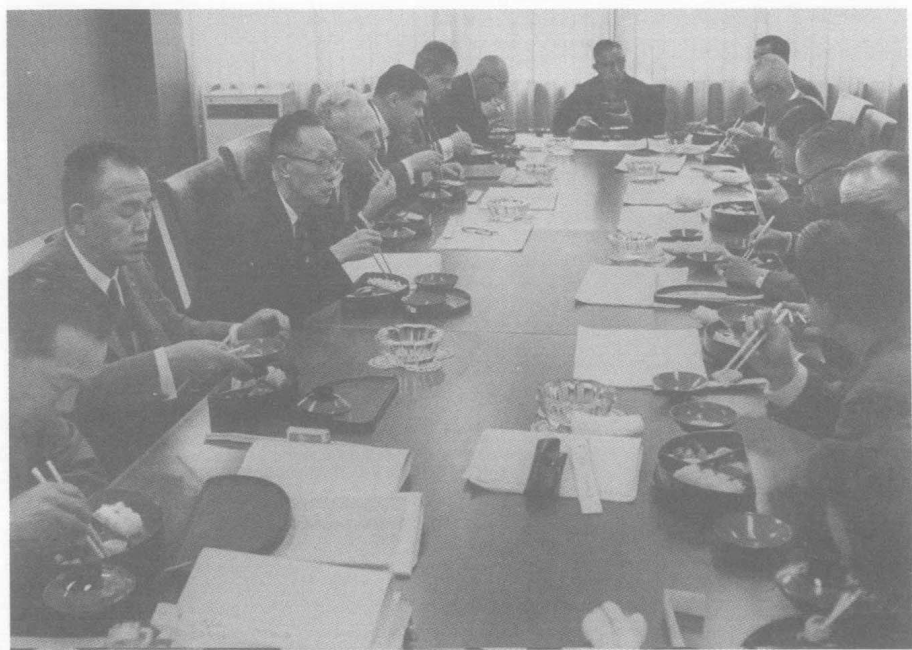
与松下电器董事会成员