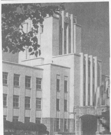
日本陆军士官学校旧址