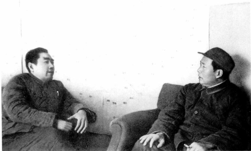
毛泽东和周恩来在一起运筹决策。