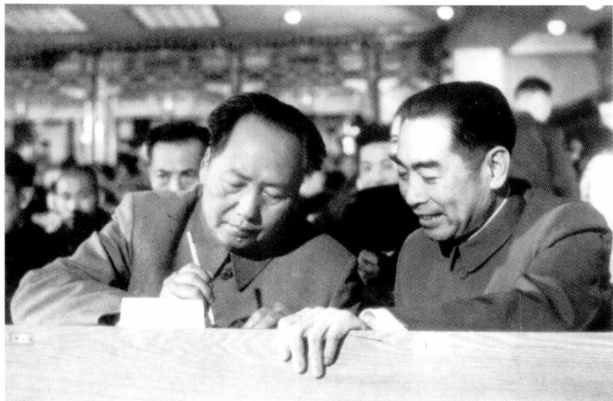
毛泽东和周恩来在会上。