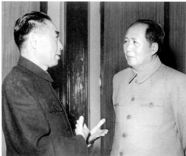
毛泽东和周恩来交谈。