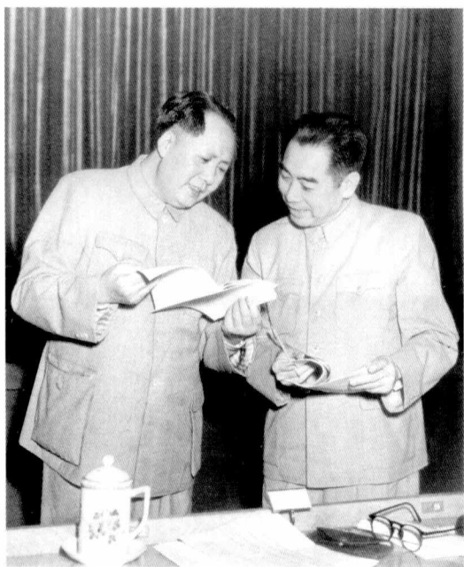
1953年，毛泽东和周恩来在中央人民政府委员会会议上。