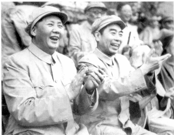
1952年8月，毛泽东和周恩来在北京先农坛体育场观看解放军体育运动会的比赛。