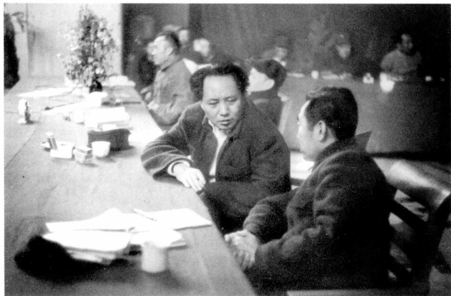
1945年4月至6月，中国共产党第七次全国代表大会在延安举行。这是毛泽东和周恩来、刘少奇、朱德在中共七届一中全会主席台上。