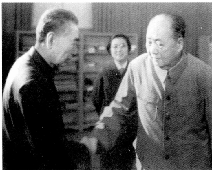
1974年5月30日，毛泽东和周恩来握手。这是两位伟人最后一张合影。