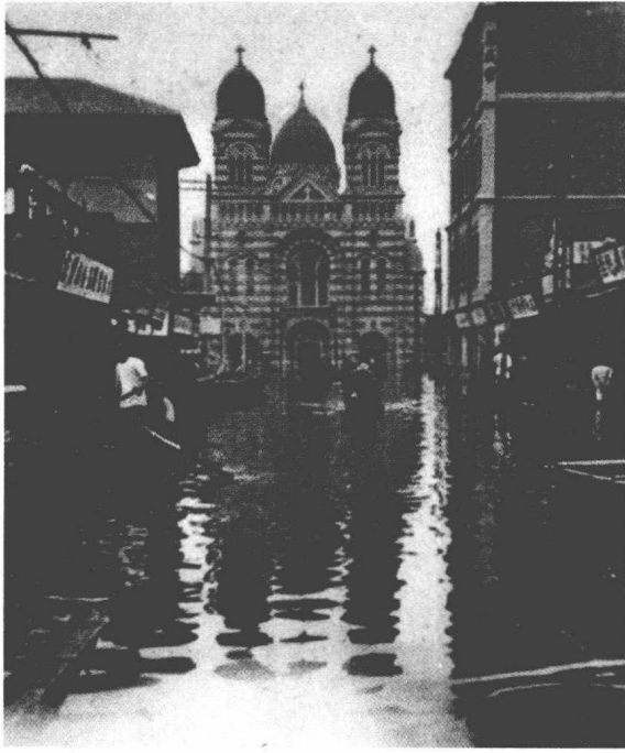
天津卫遭受洪灾情景