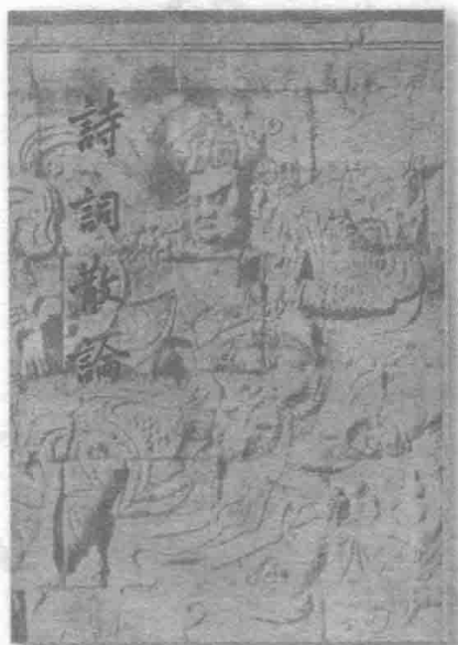
开明书店 1948 年版