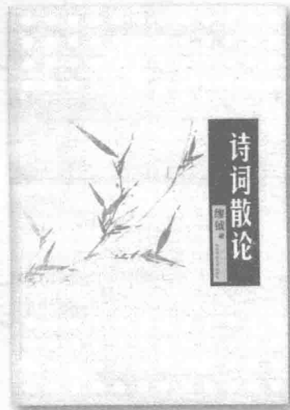
陕西师范大学出版社 2008 年版