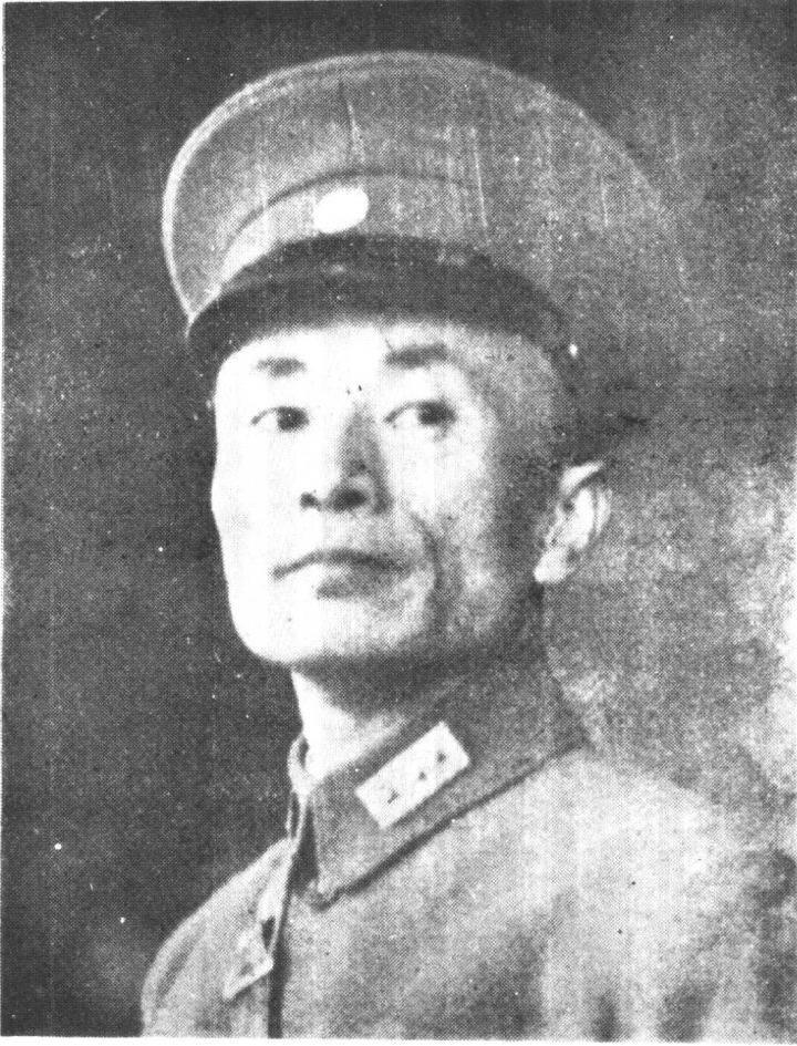
在江蘇省政府主席兼全省保安司令任內