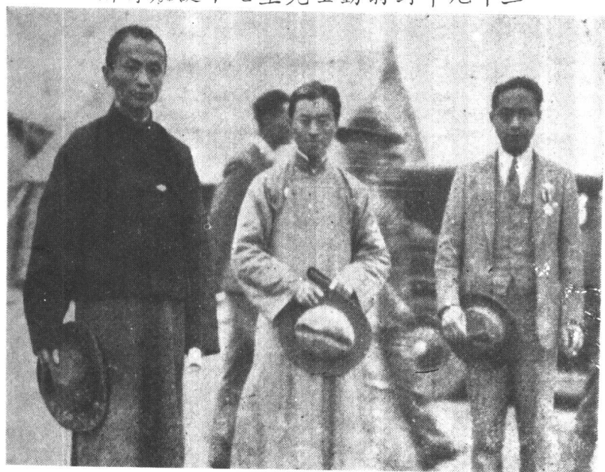
影合生先先騮朱生先夫立弟介與