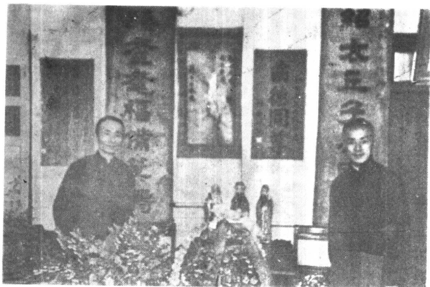
攝時辰誕十七生先士勤翁封年九十二