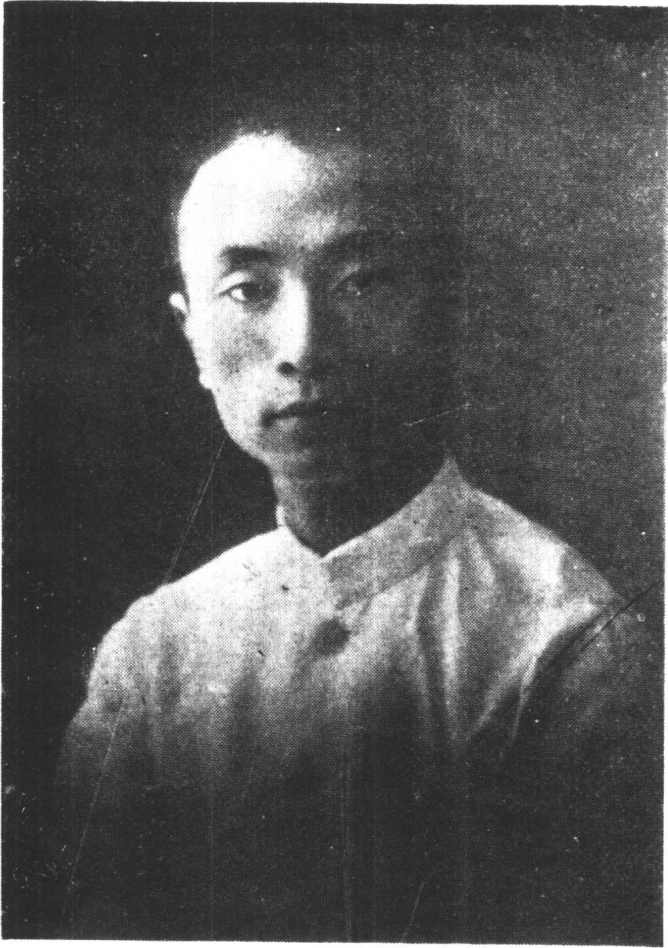
代 時 年 青