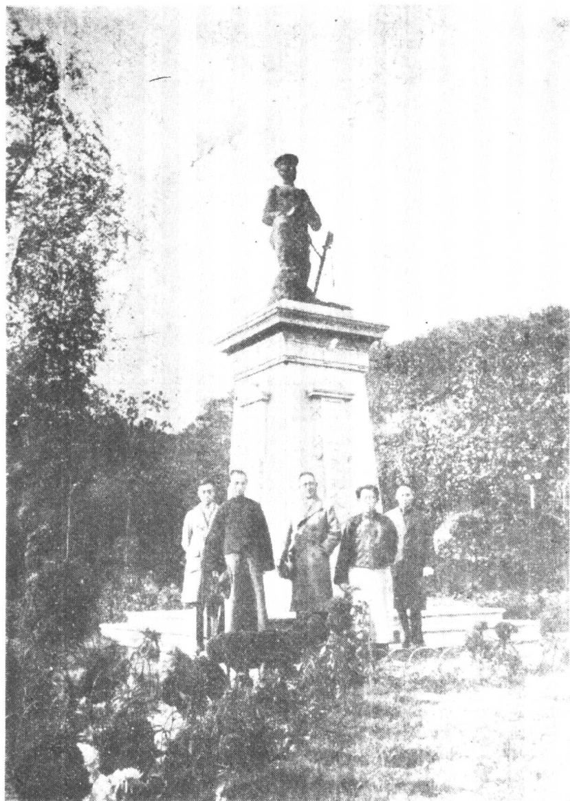
弟介希志羅三墨顧之敬何偕年一十二 影合園公先伯江鎮在生先四夫立