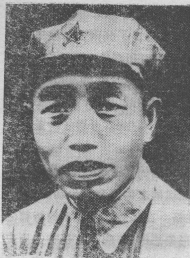
谭震林 摄于一九三七年春