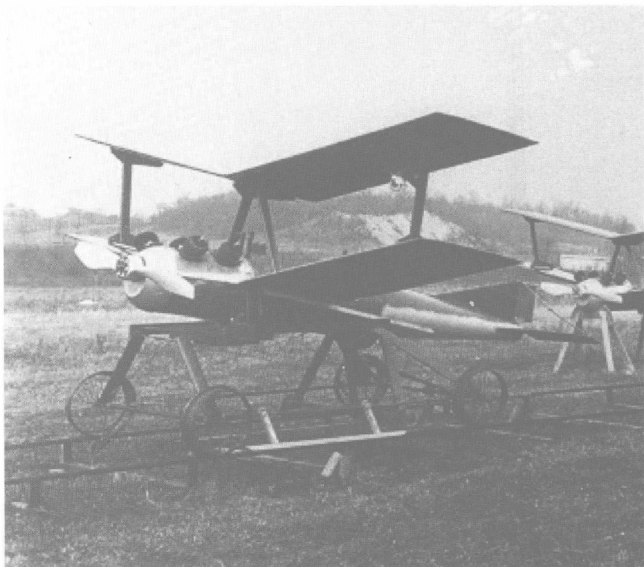
图 1.1 凯特林航空鱼雷

第一次世界大战初期,凯特林(“昆虫”)航空鱼雷(图 1.1)研制成功,它从铁轨上进行发射,飞越敌方领土,并冲入敌人的防线。这种鱼雷携带 180 磅(1 磅 \approx 0.45 kg) 烈性炸药,在撞击地面时被引爆。凯特林航空鱼雷的飞行轨迹是开环控制的,由发射方向决定,并且受航路上气流的影响。在航空鱼雷的飞行过程中,通过对螺旋桨的转数进行计数来估计其飞行距离,在预先计算好的位置停止发动机并丢弃机翼,从而实现武器的自动投放。