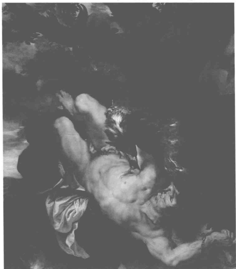
彼得·保罗·鲁本斯所作《被缚的普罗米修斯》(1611/1612—1618) 现藏于费城艺术博物馆