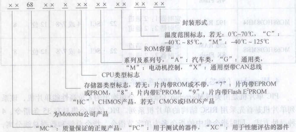
图 0-2 MC68HC 系列单片机型号含义

MC68HC 系列单片机是 Motorola 公司推出的 8 位单片机，其型号庞大，但是同一系列单片机的 CPU 均相同，指令系统相同。它与 51 系列单片机不兼容，程序指令也不相同。其单片机的型号含义如图 0-2 所示。