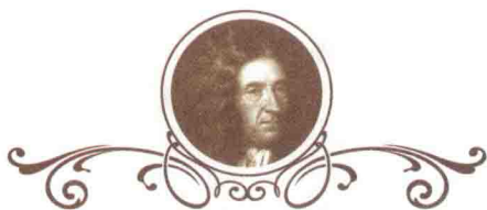
dí fú 笛福

dí fú shì yīng guó xiǎo shuō jiā chū shēng yú shāng rén jiā tíng 笛福是英国小说家，出生于商人家庭，