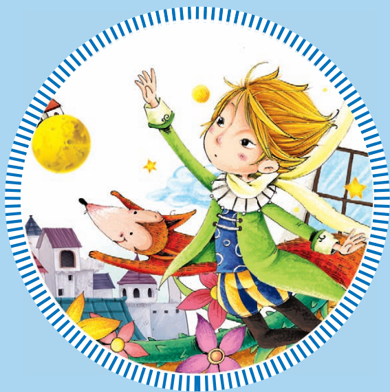
插图 / 梁胜