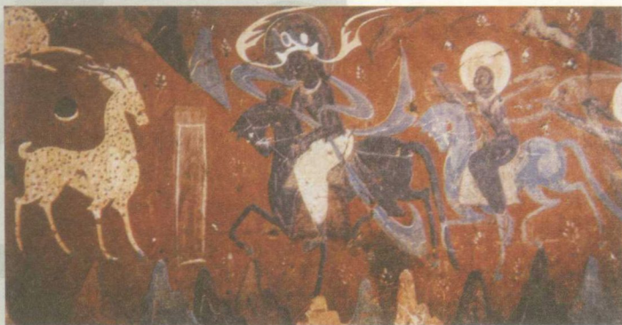
《鹿王本生故事》莫高窟壁画（北魏）

夏、商、西周及春秋、战国时期，绘画已有了相当的进步。古籍中已出现有关绘画活动的记载，如周代宫廷及明堂中已有历史人物的画像，春秋时楚先王庙及卿祠堂中也绘有历史、神话等内容的大型壁画。在河南安阳商代殷墟遗址及陕西扶风西周墓葬的发掘中都曾发现壁画残迹，两相印证，可知壁画已流行于当时上层社会。这时的绘画形象，可从青铜器及玉器上的装饰纹样，战国时期漆器上的彩画，特别是湖南长沙战国楚墓中出土的帛画和缯书图像中，看出中国绘画在当时已达到较高水平，为秦汉时期绘画艺术的发展奠定了基础。从绘画风格上看，商代庄严神秘而绚丽，西周趋于典雅。春秋以后，社会和思想观念发生巨大变化，绘画内容逐渐更多地反映社会生活，形象活泼生动，技巧上有了巨大的飞跃。