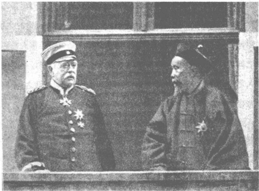
李鸿章与德意志帝国宰相俾斯麦在一起

不宁惟是。凡一国今日之现象，必与其国前此之历史相应。故前史者，现象之原因；而现象者，前史之结果也。夫以李鸿章与今日之中国，其关系既如此其深厚，则欲论李鸿章之人物，势不可不以如炬之目观察