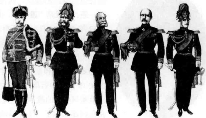
1870 年间普鲁士的主要首脑：国王（中）左边的是俾斯麦首相和毛奇伯爵。

则认为，应把奥地利排除在外，建立一个由普鲁士领导的统一的小德意志帝国，称“小德意志派”，这个“小德意志帝国”则是一个纯粹由日耳曼民族组成的单一民族的国家。这次预备会议上奥地利占了上风，选出了奥地利的约