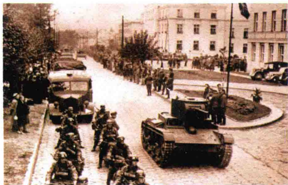
苏军趁德军西进之机，也出兵波兰，并占领了波兰东部的领土，图为苏联坦克经过一支德国军队。

在这个事件中，应该说爱沙尼亚政府措施不当，看守不力，有失职之过，至于其中有没有其他原因就不得而知了，但原因不重要，苏联要的只是一个借口。9月19日，苏联以波兰“雄鹰”号潜艇事件开始向爱沙尼亚政府施加压力，声称波兰“雄鹰”号潜艇就活动在波罗的海三国的水域内，对苏联的船只构成了威胁，苏联将不承认爱沙尼亚对它的