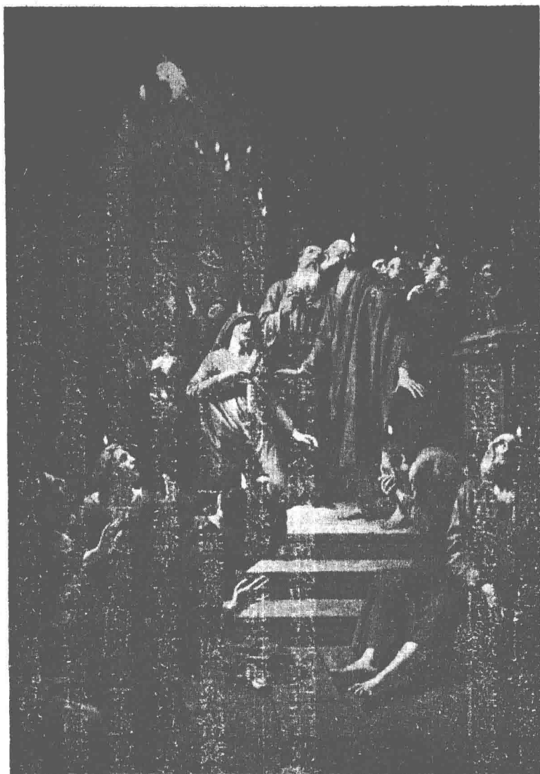
臨降靈聖節旬五 圖一第