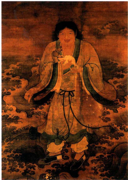
刘俊 明代 轴 绢本 设色 139 × 98cm 中国美术馆藏

画中刘海居中，呈正面像，双手捧蟾，神态和善欢悦；宽袍大袖，衣带飘动，与海涛相谐，一派得道成仙之相。全画风格工谨，设色淡雅。