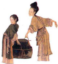
第一影响力艺术宝库