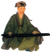
第一影响力艺术宝库