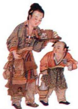
第一影响力艺术宝库

面。初唐的人物画分中原风格与边区风格两种，在人物的造型及气质风度的刻画上大大前进了一步。盛唐是人物画发展的高峰期，宗教画、肖像画、仕女画、历史画、风俗画都有大量作品产生，题材开始扩展到日常生活中，优秀的人物画家层出不穷。中晚唐时期的人物画在表现方式上及笔法上都有了新的创造，更加提高了中国人物画的形式美的价值。此外敦煌艺术在唐代同样达到了辉煌的高度，也是当时整个绘画艺术不可或缺的部分。