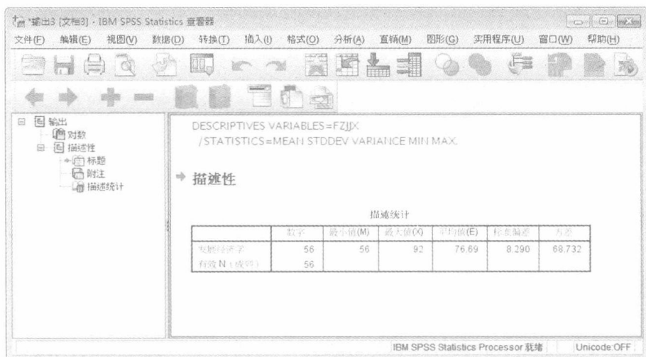
图 1.3 结果输出窗口