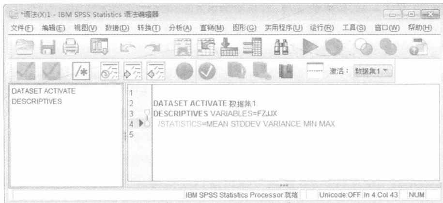
图 1.4 语法编辑窗口

SPSS 语句窗口即语法编辑窗口,是编辑和运行命令文件的窗口,如图 1.4 所示。该窗口可能更适用于具有编程基础的人员使用,它不仅可以编辑不能实现的特殊过程的命令语句,还可以将大量的分析过程汇集在一个命令文件中。用户还可以根据自己的需求对语句窗口中的命令进行修改、编辑、复制及粘贴等,也可以编写针对当前数据文件的命令程序。该窗口的内容可存为 .sps 为扩展名的 SPSS 文件。