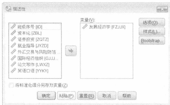
图 1.5 语法编辑窗口