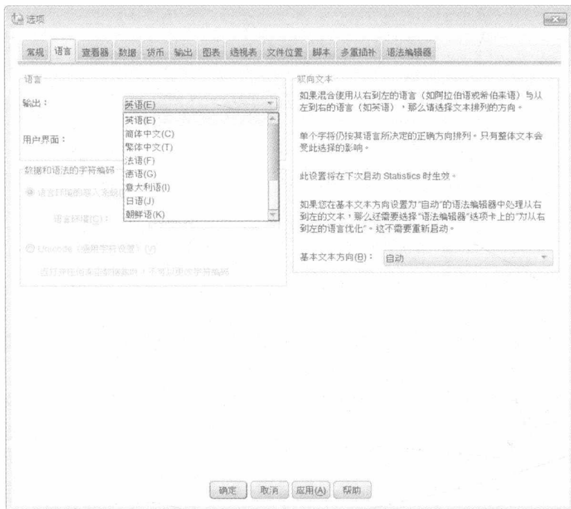
图 1.2 SPSS 中英文切换窗口

SPSS 允许同时打开多个数据编辑窗口,分别显示不同的数据文件内容,数据窗口中的数据也称为数据集,这些数据通常以 SPSS 数据文件的形式保存在计算机上,其文件扩展名为 .sav。