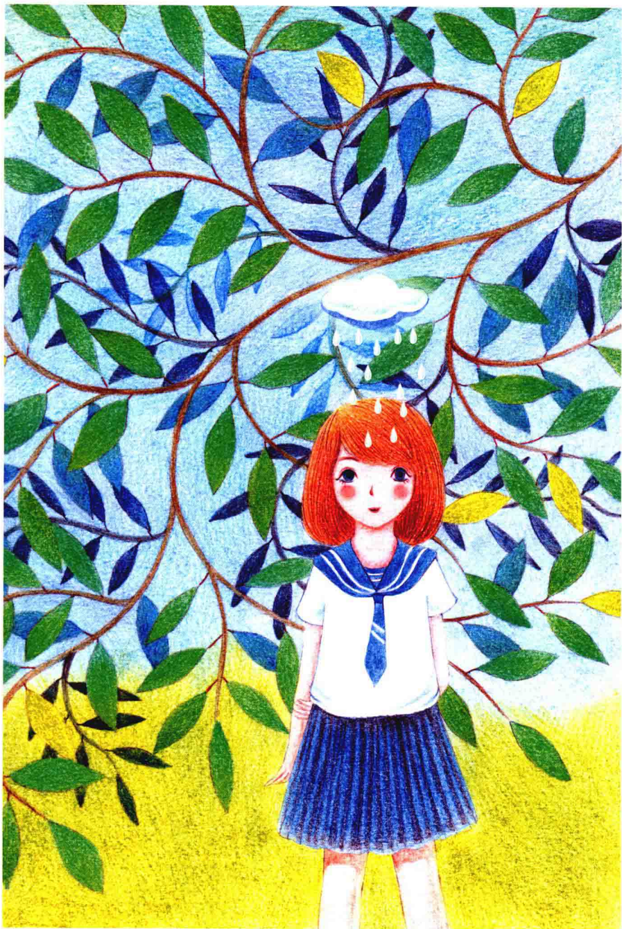
来自魔幻星球的李超善良、美丽，勇敢地肩负起拯救星球的使命