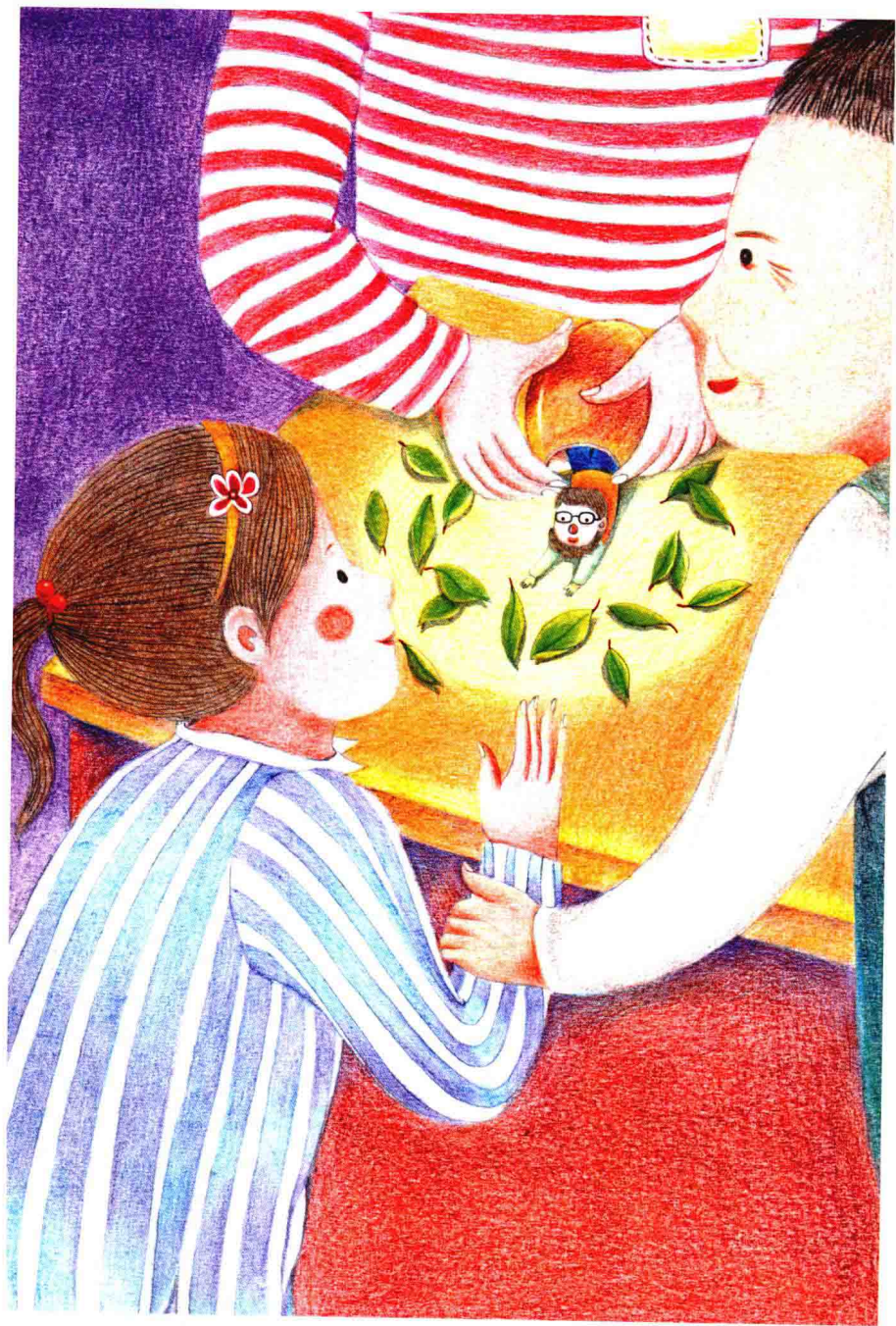
爸爸表演魔术，花样百出，为患病的小女孩儿带去快乐和慰藉