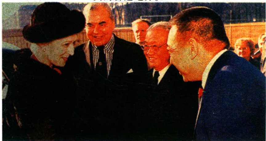
董浩云、董建华与英国雅丽珊郡主。