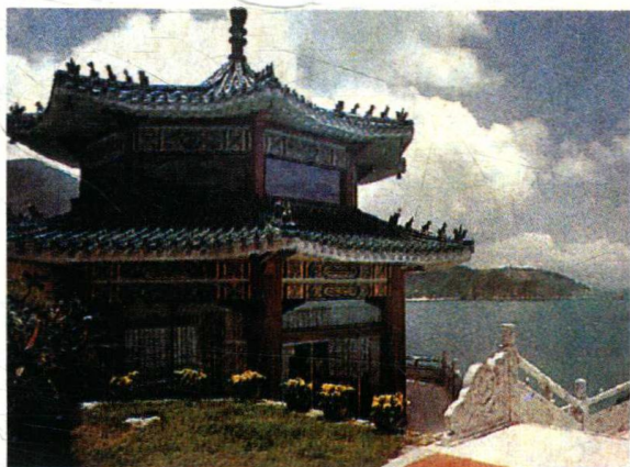
董家别墅香岛小筑是董家接待贵宾的首选地方。