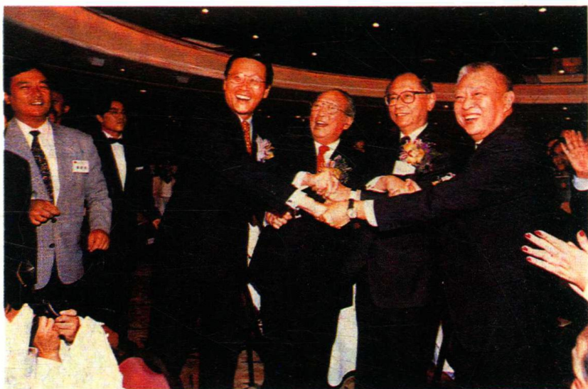
四位热门香港首届行政长官参选人齐齐握手。