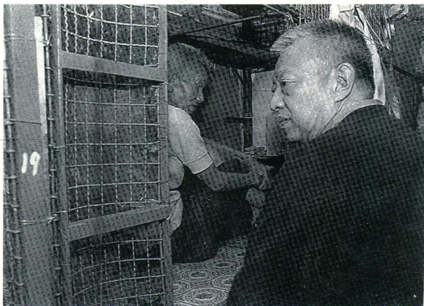
董建华体验基层生活,探望香港一名老年笼民。