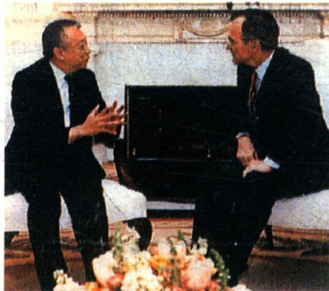
董建华与美国前总统布什私交甚厚。