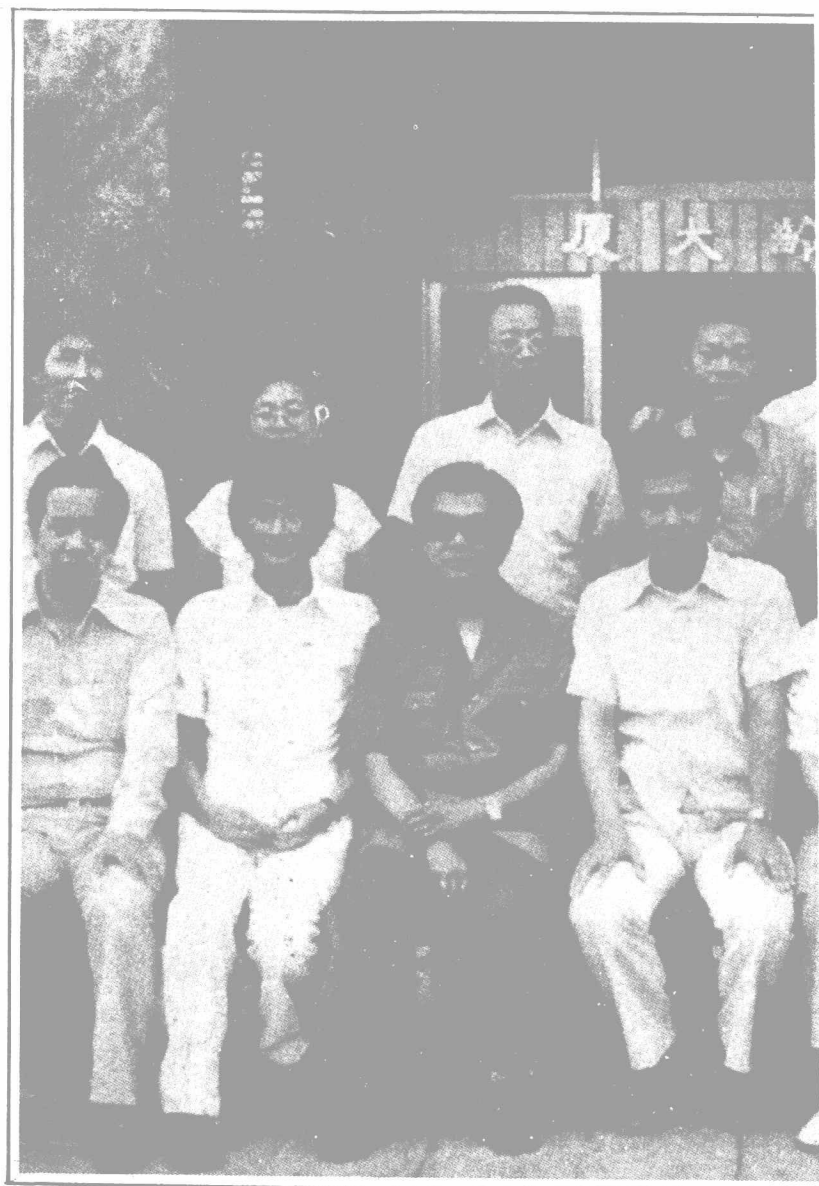
■「美麗島」主要成員合影。