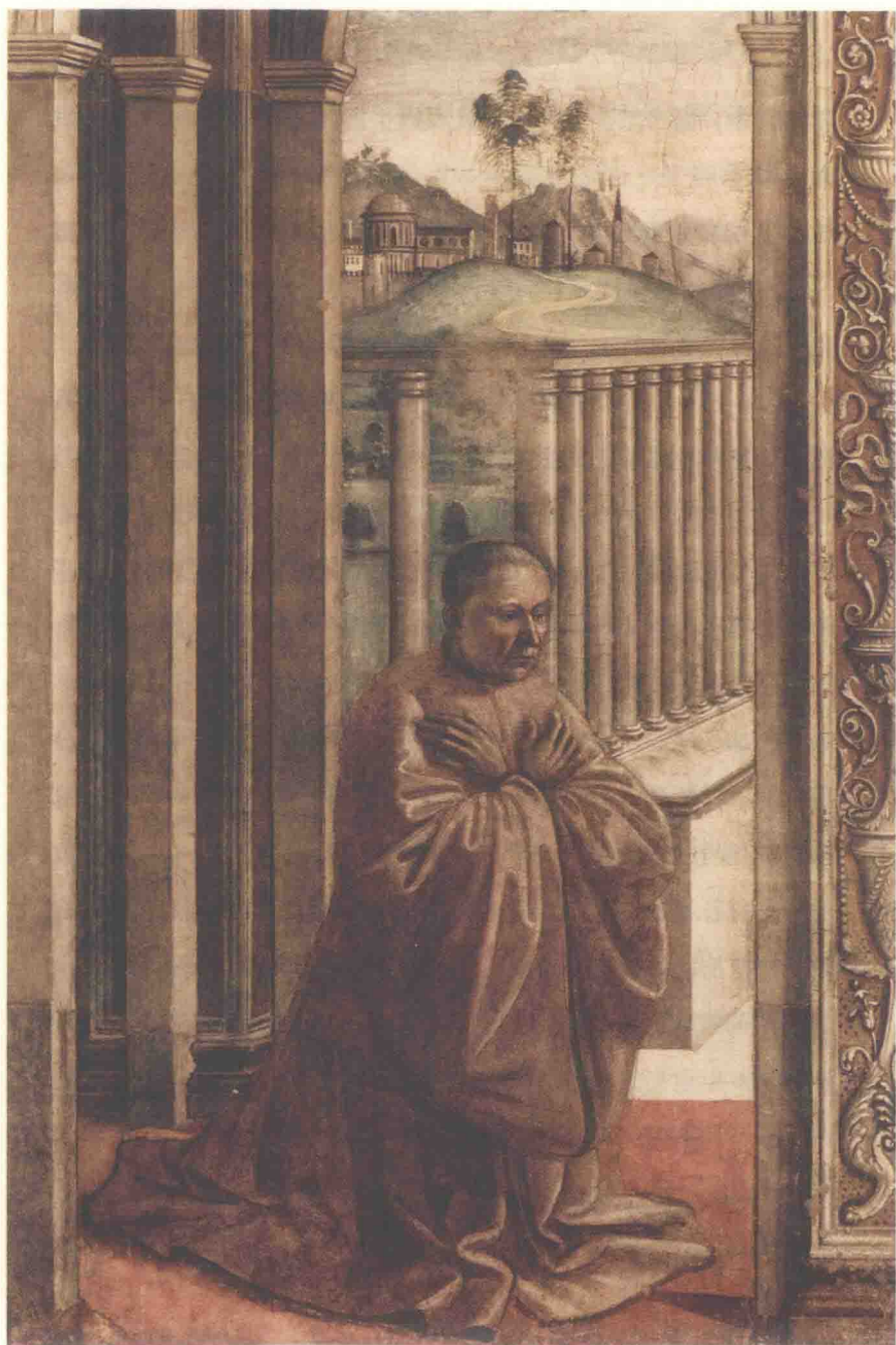
图4 多米尼克·基尔兰达约：《乔万尼·德格里·阿尔比奇的肖像》，佛罗伦萨新圣母大殿主礼拜堂