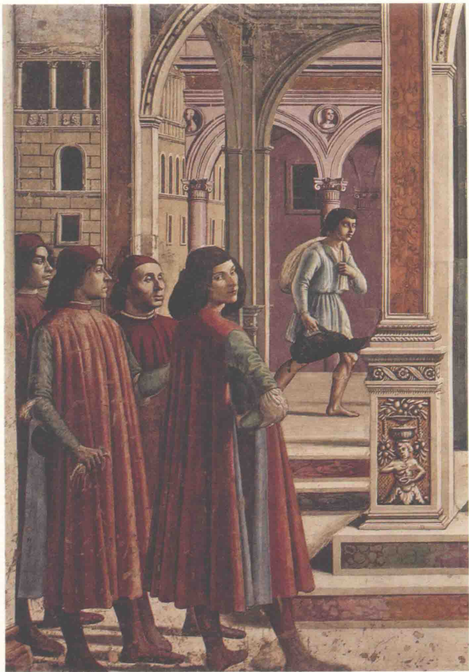
图1 多米尼克·基尔兰达约和助手们《约阿希姆逐出寺庙》(局部)