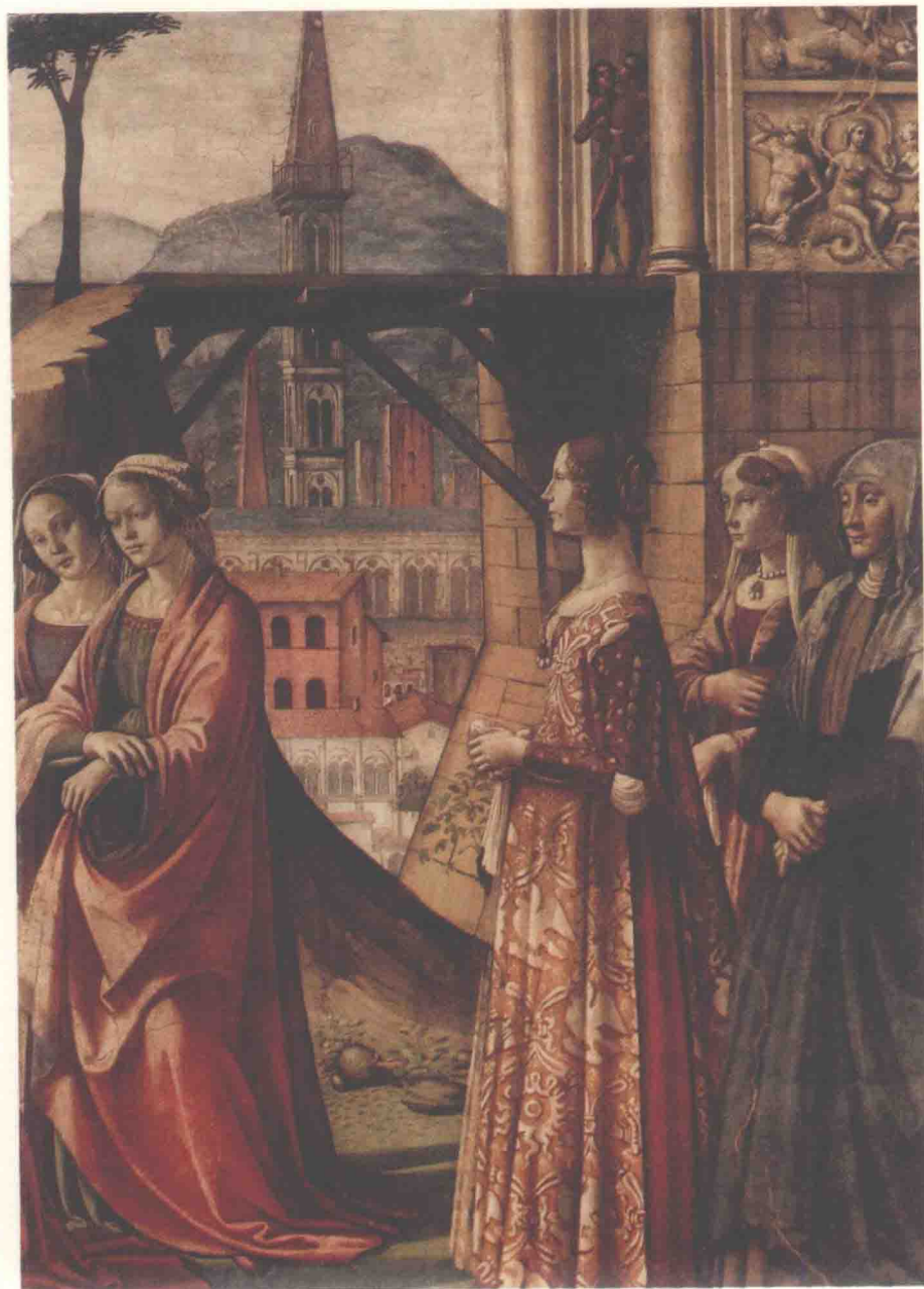
图2 多米尼克·基尔兰达约和助手们《圣母访亲》(局部)