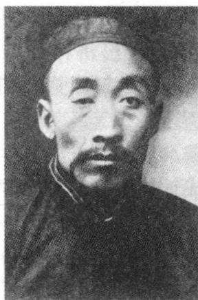
毛泽东的父亲毛顺生 (1870—1920)、母亲 文素勤 (1867—1919)