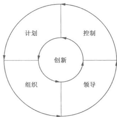
图 1-1 管理职能循环图

各项管理职能的相互关系如图 1-1 所示。每一项管理工作一般都是从计划开始，经过组织、领导到控制结束。各职能之间同时相互交叉渗透，控制的结果可能又导致新的计划，开始新一轮新的管理循环。如此循环不息，把工作不断推向前进。创新在这管理循环之中处于轴心的地位，成为推动管理循环的原动力。