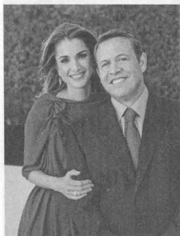
2010年,阿卜杜拉二世与拉尼亚王后。