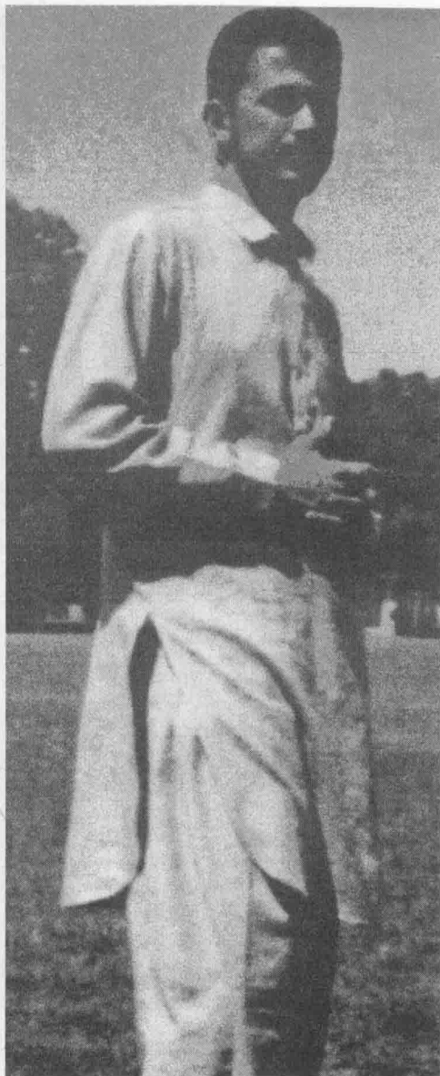
1989年，扎卡维离开约旦奔 赴阿富汗之前的留影。