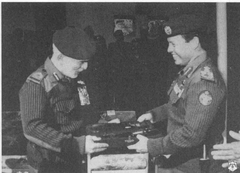
戎装阿卜杜拉王子(右)将一把礼仪用的匕首送给父亲侯赛因。