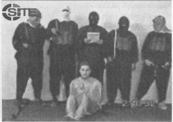
2004年，扎卡维（后排中）残杀美国人质尼克·伯格（前排坐姿）的视频截图。