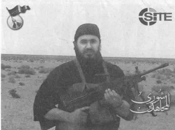
2006年，扎卡维在极端主义恐怖视频中亮相，教授枪械的使用。许多极端分子被扎卡维“勇敢”“善战”的名声所吸引，纷纷投到他的帐下。