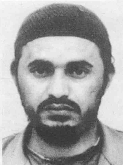
1994年，扎卡维被捕入狱。1999 年，他因为大赦被释放。照片摄 于他在贾法尔监狱服刑期间。