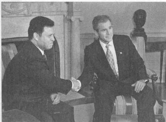
2011年,阿卜杜拉二世(左)于“9·11”事件后访美。他和布什的会谈气氛融洽。不过,国王仍然警告总统:入侵伊拉克等于打开了潘多拉魔盒。