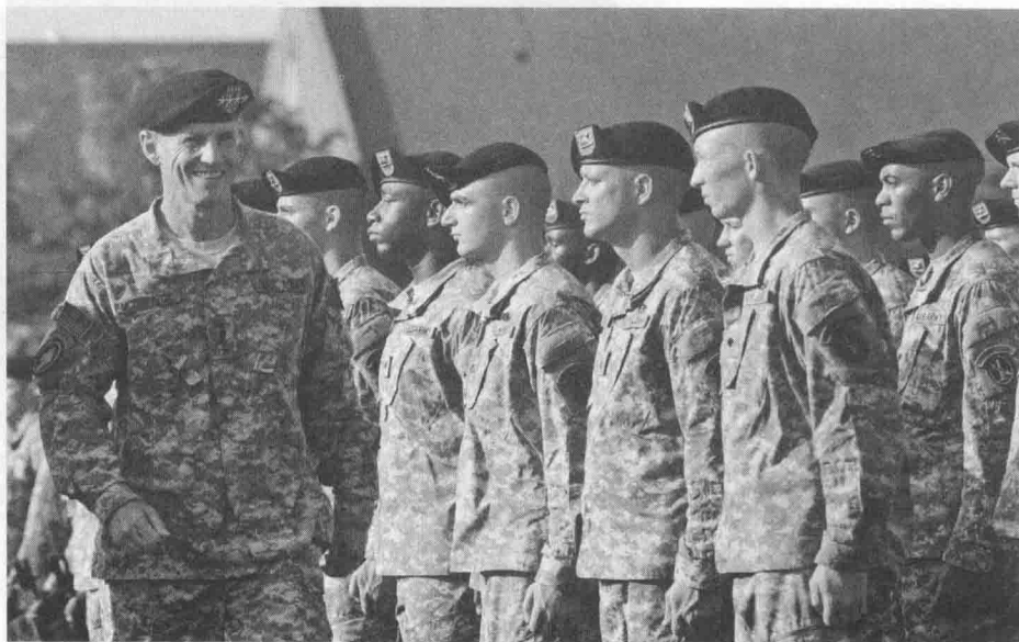
2010年，斯坦利·麦克里斯特尔将军（左，正面）视察部队。麦克里斯特尔曾是驻伊拉克特种部队负责人。