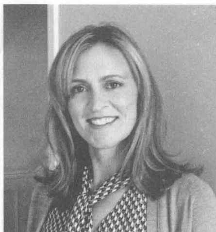
纳达·巴科斯（2014年）。她曾是追踪扎卡维的头号“猎手”。