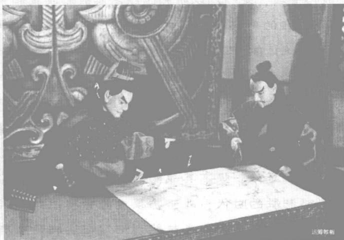
战略管理：运筹帷幄 决胜千里

夫未战而庙算胜者，得算多也；未战而庙算不胜者，得算少也。多算胜，少算不胜，而况于无算乎！吾以此观之，胜负见矣。