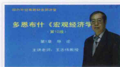
▲北京大学王志伟教授