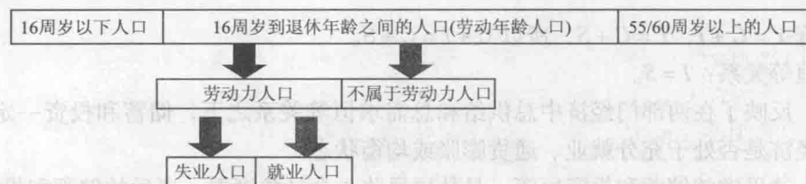
图 12-2 三种类型的人

一个经济中的人可以被归入三种类型：就业、失业, 或者不属于劳动力。按照我国规定, 16 周岁以下人口属于童工(不能聘用), 女性 55 周岁退休, 男性 60 周岁退休(可认定为丧失劳动能力而退出工作岗位)。如图 12-2 所示, 可得出各种类型之间的关系和区别。