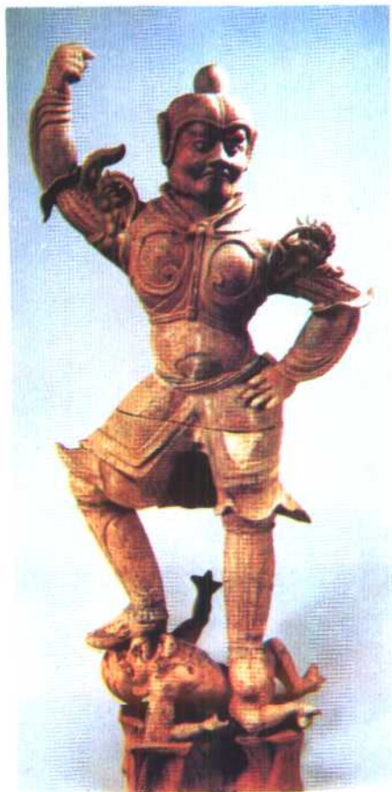
(甘肃敦煌老爷庙出土) 唐朝身着甲冑的陶武士俑