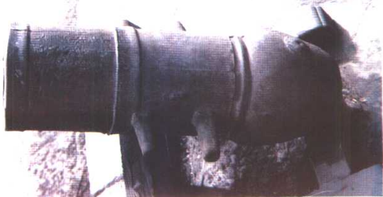
明朝洪武十年（1377年）造铁炮