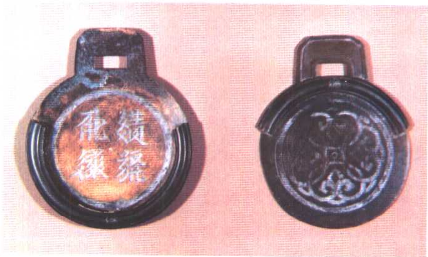
西夏驿站传递文书用的敕牌