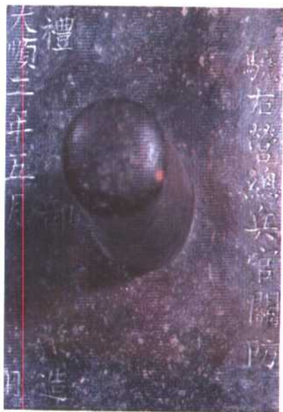
明末农民起义领袖张献忠大西政权铸造的铜印