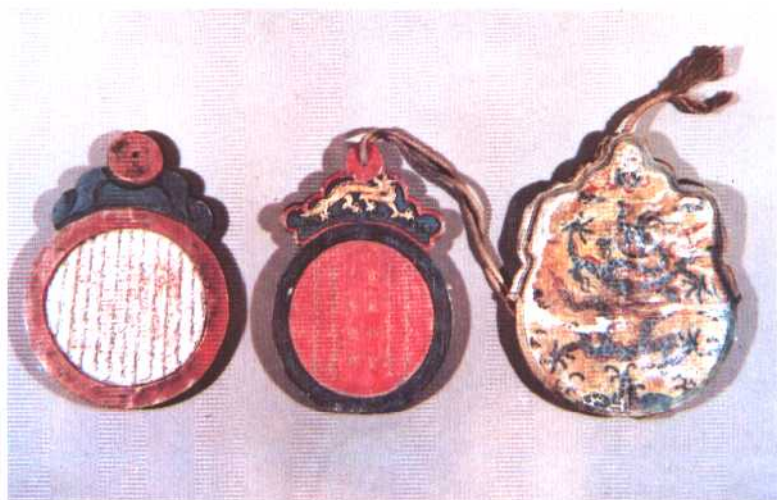
清太宗皇太极调兵用的满文信牌