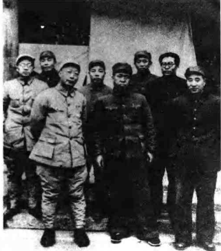
1948年12月， 林彪、罗荣桓、聂 荣臻、高岗等在平 津前线司令部。