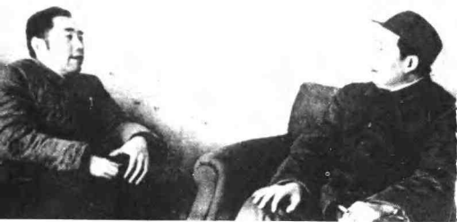
毛泽东和周恩来1948年在西柏坡运筹三大战役