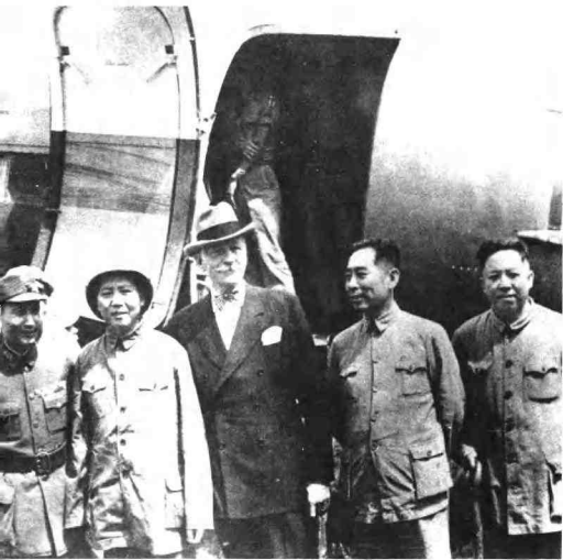
1945年8月28日，毛泽东主席应蒋介石的邀请，在美国驻华大使赫尔利和国民党代表张治中的陪同下，偕周恩来、王若飞赴重庆谈判。