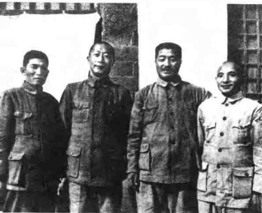
1949年3月，邓小平、贺龙、聂荣臻、蔡树藩在石家庄合影。