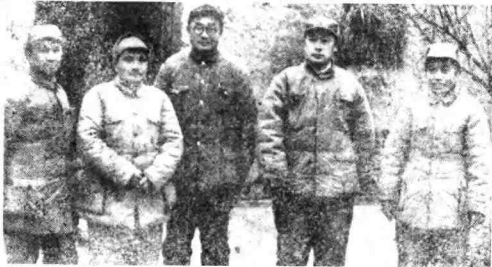
淮海战役我军总前委成员，自左至右：粟裕、邓小平、刘伯承、陈毅、谭震林在前线司令部。

1948年冬季，淮海战役，我军围歼了国民党四十四军。这是我部队在收集敌人遗弃的武器。