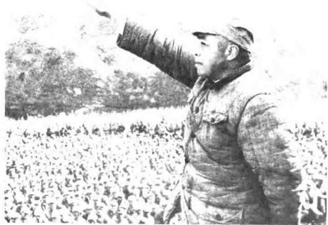
1947年4月，彭德怀司令员在保卫陕甘宁边区，反对内战动员大会上讲话。