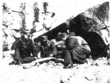
1948年林彪、 罗荣桓、刘亚楼在 辽沈前线。