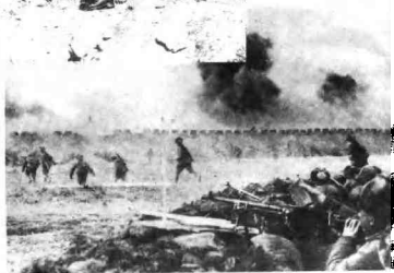
1948年10月，东 北野战军向锦州发起 进攻。