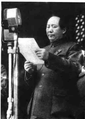
1949年10月1日，毛泽东主席在天安门城楼上宣布新中国诞生。