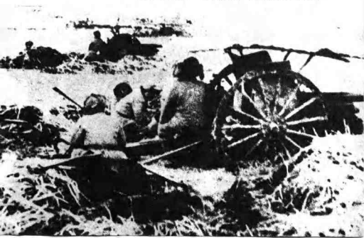
1949年1月，平津战役，我军的炮兵阵地。