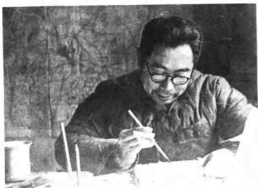
周恩来签署作战命令。 中共中央军委副主席兼总参谋长