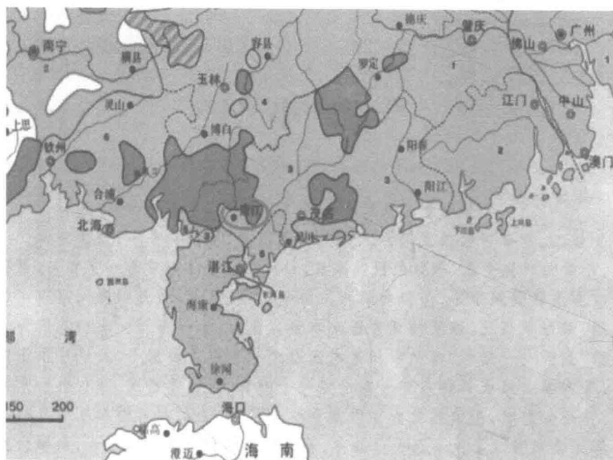
图1 《中国语言地图集》(1987, B8的截图)上的廉江(圆圈内)