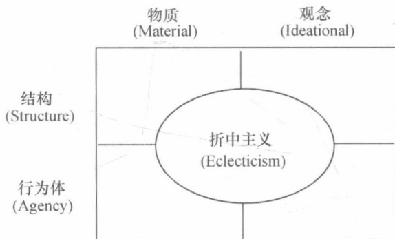
图1 折中主义与“行为体与结构”和“物质与观念”之间的关系 ③

在实际运用中，这就要求横跨不同的分析层面并超越假定存在于可观察的实在因素和不可观察的认知因素或观念因素之间的鸿沟（见图1）。对于分析折中主义试图揭示的实在问题，即有关社会现实领域中“行为体与结构”或“物质与观念”的本体论假设，将不会被视为因果机制中的首要因素，不会再纠结于是行为体还是结构，是物质还是观念，换句话说，分析折中主义不会以本体论的争论为首要任务。 ① 分析折中主义研究考虑的是，世界政治中的个人和集体行为者在特定的环境下是如何形成并追求其物质和观念的偏好，以及如何改变其偏好的。 ②