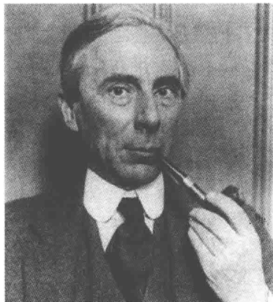
图 1.3 伯特兰·罗素(1872—1970)

现代礼仪就其外在形式比古礼简化了许多，但是内容却因为经济、信息的全球化而变得更为丰富多元。但是，万变不离其宗的是礼仪所承载和传递的“仁德”理念，著名收藏家马未都先生说过：“文化求异，但是文明趋同。”社会任何一个层面的进步都是为了人们生活得更为幸福，礼仪存在的本意不是为了展示刻板教条的规矩，而是为了人与人之间、人与自然之间的和谐共生。今日之礼仪仍是重在“礼”，礼的首要含义是“仁德之心”，其次的含义才是具象的礼节；“仪”是外在的表现。现代礼仪即为人们在社会生活实践中承载与表达仁德尊重之心的礼节和仪式，它影响着人们的生活品质，关系着人类社会的进步。