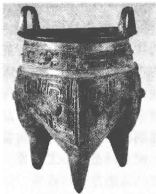
图 1.2 古代礼器“豐”和“鬲”