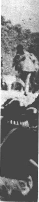
警察逮捕美国神父“希脑特”。