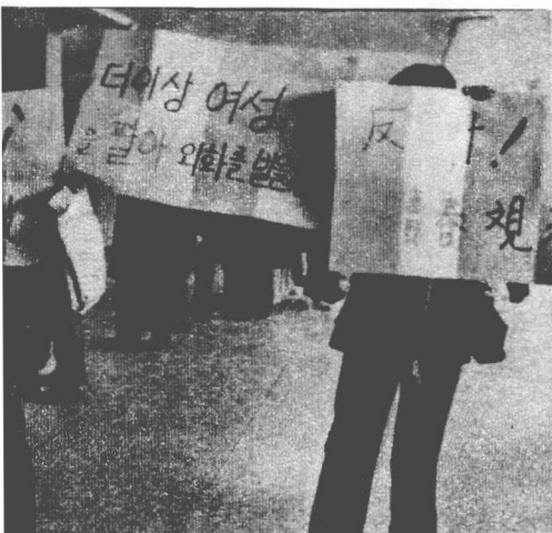
梨花女大的学生在金浦机场，高举“反对日本人的妓女观光”的标语牌，表示抗议。