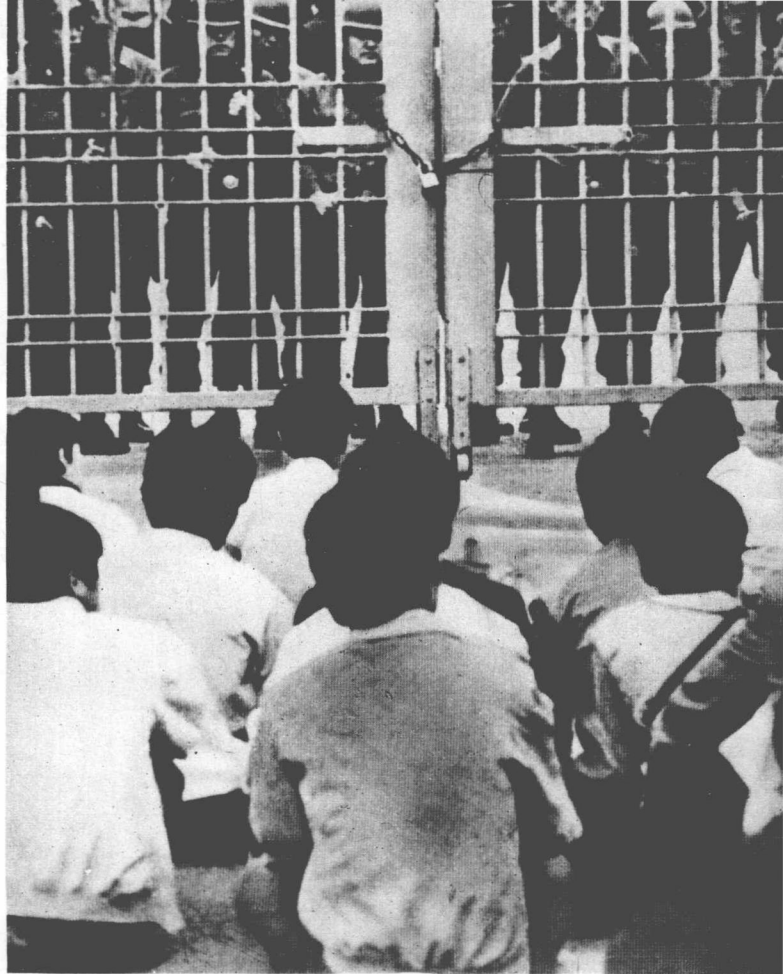
为了争取自由进行斗争的南朝鲜学生和知识分子。