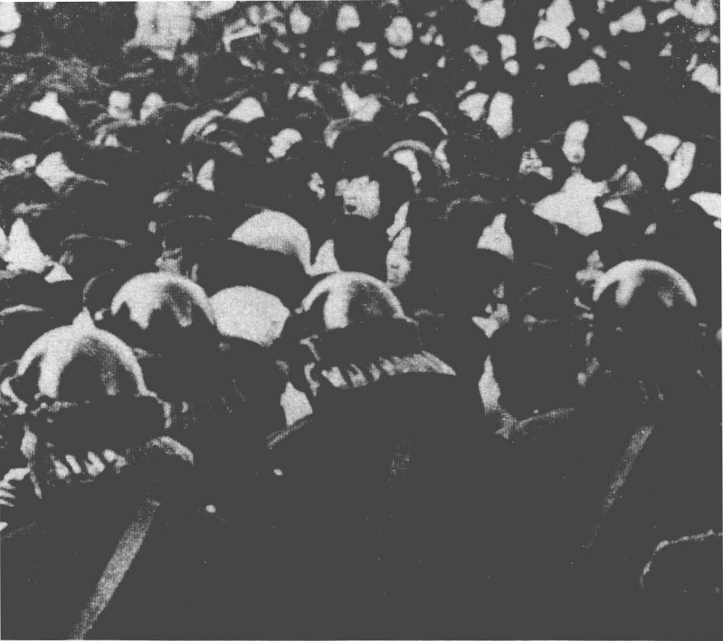
梨花女大的学生们奋起举行反政府示威游行。