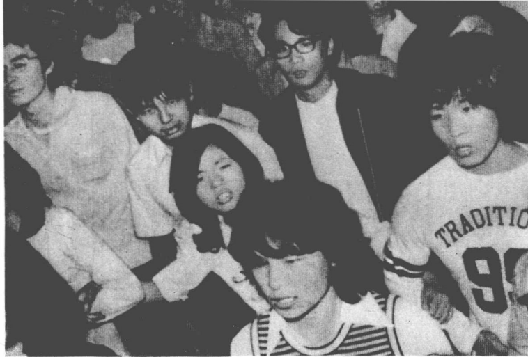
日本人民积极支持南朝鲜人民争取自由和民主的斗争。