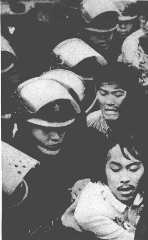
示威群众抗议朴正熙傀儡集团对 南朝鲜民主人士的屠杀暴行。 (在南朝鲜傀儡驻日大使馆前)