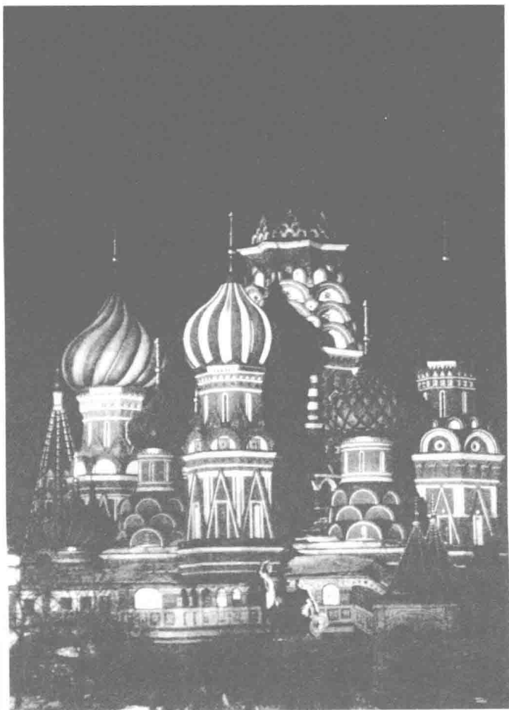
伊万四世时代修建的莫斯科圣巴西尔大教堂

类似的情况也在季米特里（1359—1389 在位）继承莫斯科大公之位时出现。季米特里虽然年少，但在大贵族与市民们的协助下，筑石城代替原来的木城，加强了莫斯科的防卫，他还努力运用军事与外交手段，包括行贿金帐汗国官吏，以求战胜俄罗斯各个诸侯。他最终兼并了弗拉基米尔、科斯特罗马、特维尔、梁赞等国，扩大了莫斯科大公国的版图。季米特里曾于 1380 年在库利科沃田野战胜蒙古人，但是蒙古人于 1382 年攻克莫斯科，季米特里又被迫对蒙古人纳贡称臣。当时，都主教阿列克塞及其所属的教士和大贵族们都曾给予季米特里以大力支持，多次鼓励市民们抵抗敌人的进攻，守卫莫斯科。