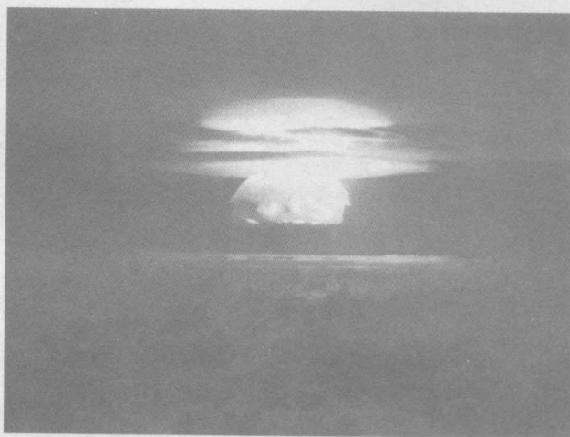
撒旦的烟火——犹如世界毁灭前夕的血色辉煌 (1954年3月1日美国进行的核试验)