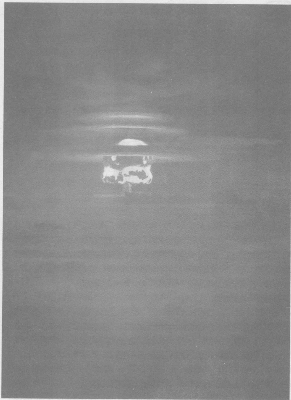
1954年5月4日，美国进行的TNT当量达1350万吨的氢弹试验